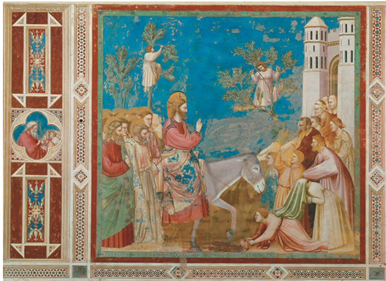
Джотто ди Бондоне. Сцена из жизни Христа. Въезд в Иерусалим. 1304–1306. Капелла Скровеньи, Падуя