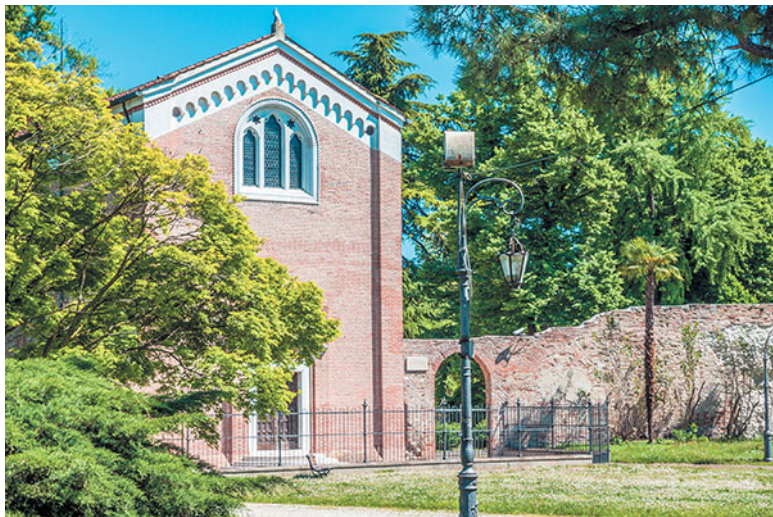
Общий вид Капеллы Скровеньи. Падуя

заказу богатого купца Энрико Скровеньи. Этим строительством он хотел искупить грехи своего отца, занимавшегося ростовщичеством. В Средневековье давать деньги в долг или требовать проценты за заем считалось грехом. Видимо, деловые качества Скровеньи-старшего были известны во всей Италии, так как даже Данте Алигьери упоминает его в своей «Божественной комедии», помещая на 7-й круг Ада (XVII, 64–75). Хотя часовня была задумана для семейного пользования, папским указом 1 марта 1304 года всем простым людям предписывалось хотя бы раз в жизни посетить эту капеллу и тем самым искупить грехи.