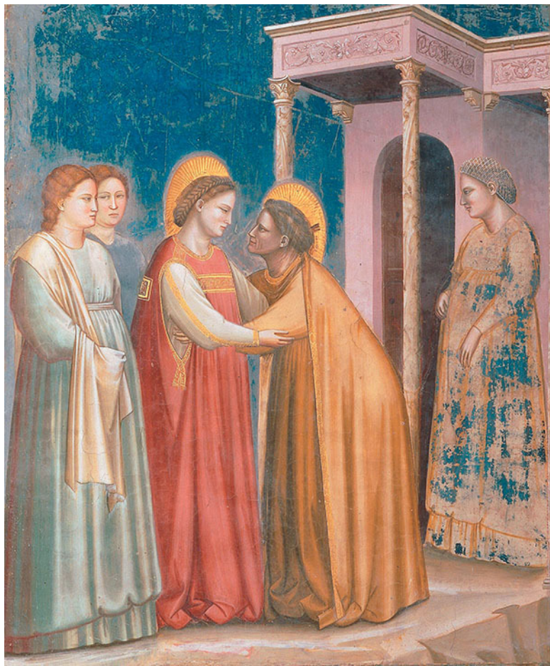
Джотто ди Бондоне. Встреча Марии и Елизаветы. 1304—1306. Капелла Скровеньи, Падуя