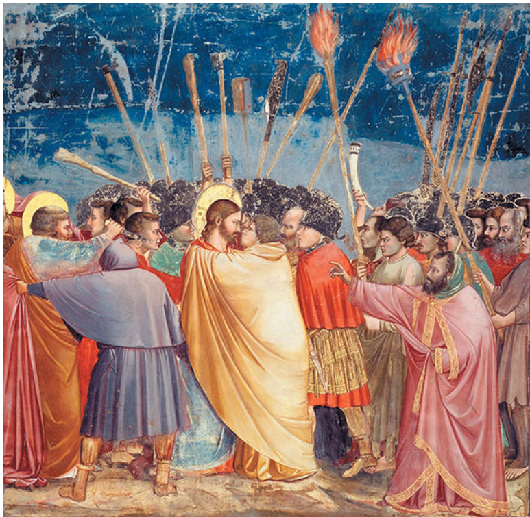
Джотто ди Бондоне. Поцелуй Иуды. 1304–1306. Капелла Скровеньи, Падуя

Совершенно гениально об этом написала Паола Волкова: «Благородное, прекрасное лицо Христа, золотые густые волосы, светлое чело, спокойный взгляд, и эта чистая шея, такая колонна шеи... серьезное, сосредоточенное, прекрасное