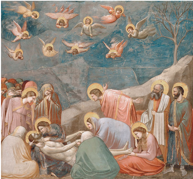
Джотто ди Бондоне. Оплакивание Христа. 1304–1306. Капелла Скровеньи, Падуя

Вместо золотого фона, свойственного византийским произведениям, Джотто создает объемный второй план – мы видим элементы архитектуры, интерьера, пейзажа . Нам не должно смущать это несколько наивное, похожее на кукольные декорации изображение, ведь еще не была изучена