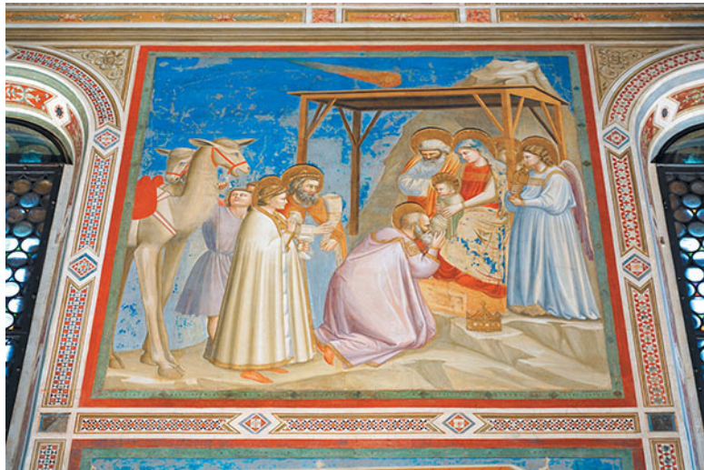
Джотто ди Бондоне. Поклонение волхвов. 1304–1306. Фреска. Капелла Скровеньи, Падуя