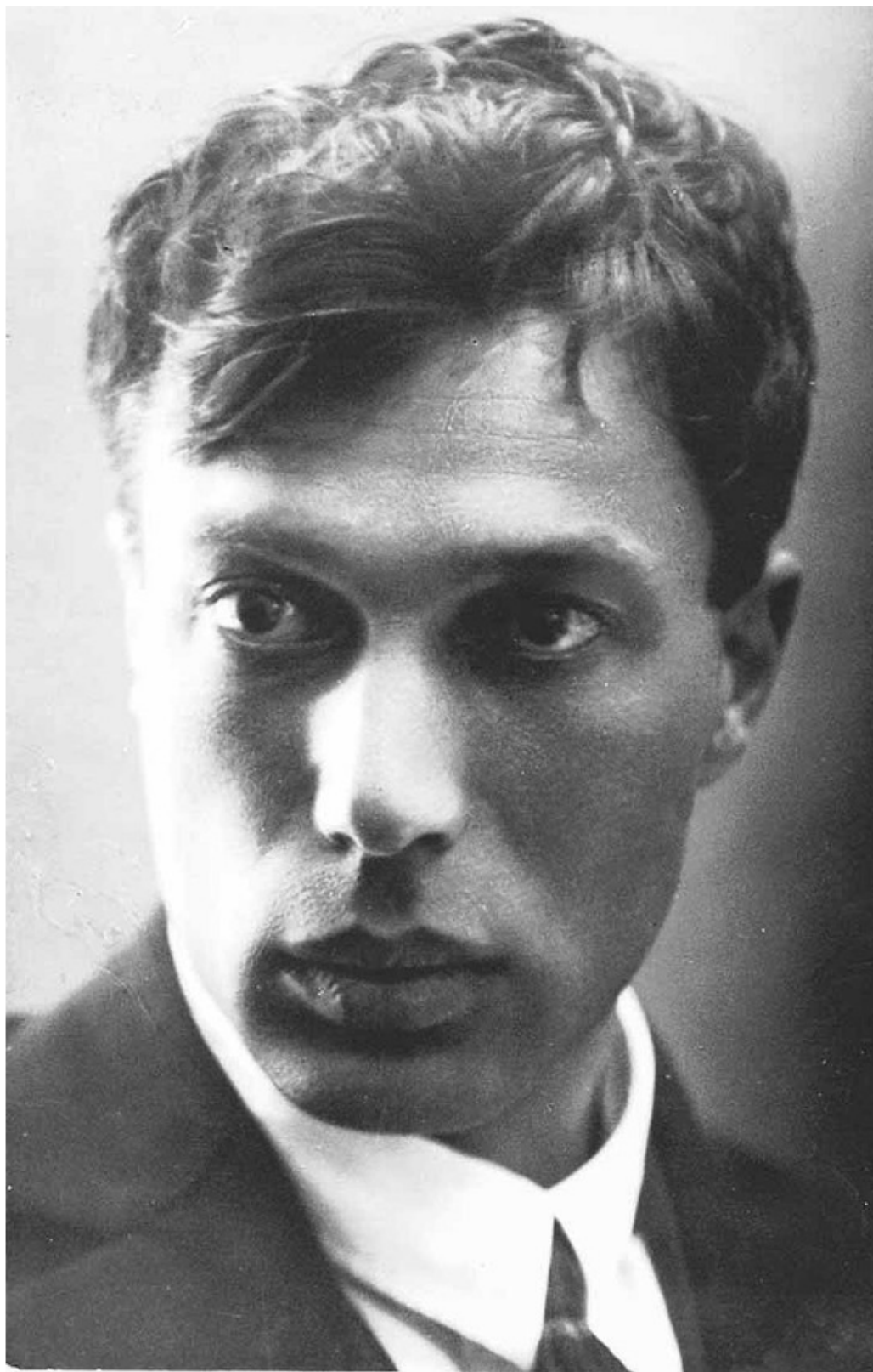
Б. Л. Пастернак. 1910-е годы.

В принципе, это объяснимо. Ни Пастернак, ни Цветаева не смогли сразу обрести собственный голос. Марине пришлось годами освобождаться от романтических штампов, унаследованных от любимых авторов, и собственной заикленности на «девичьих» темах. Процесс шел постепенно, по мере того, как юная женщина нащупывала свою реальную, а не выдуман-