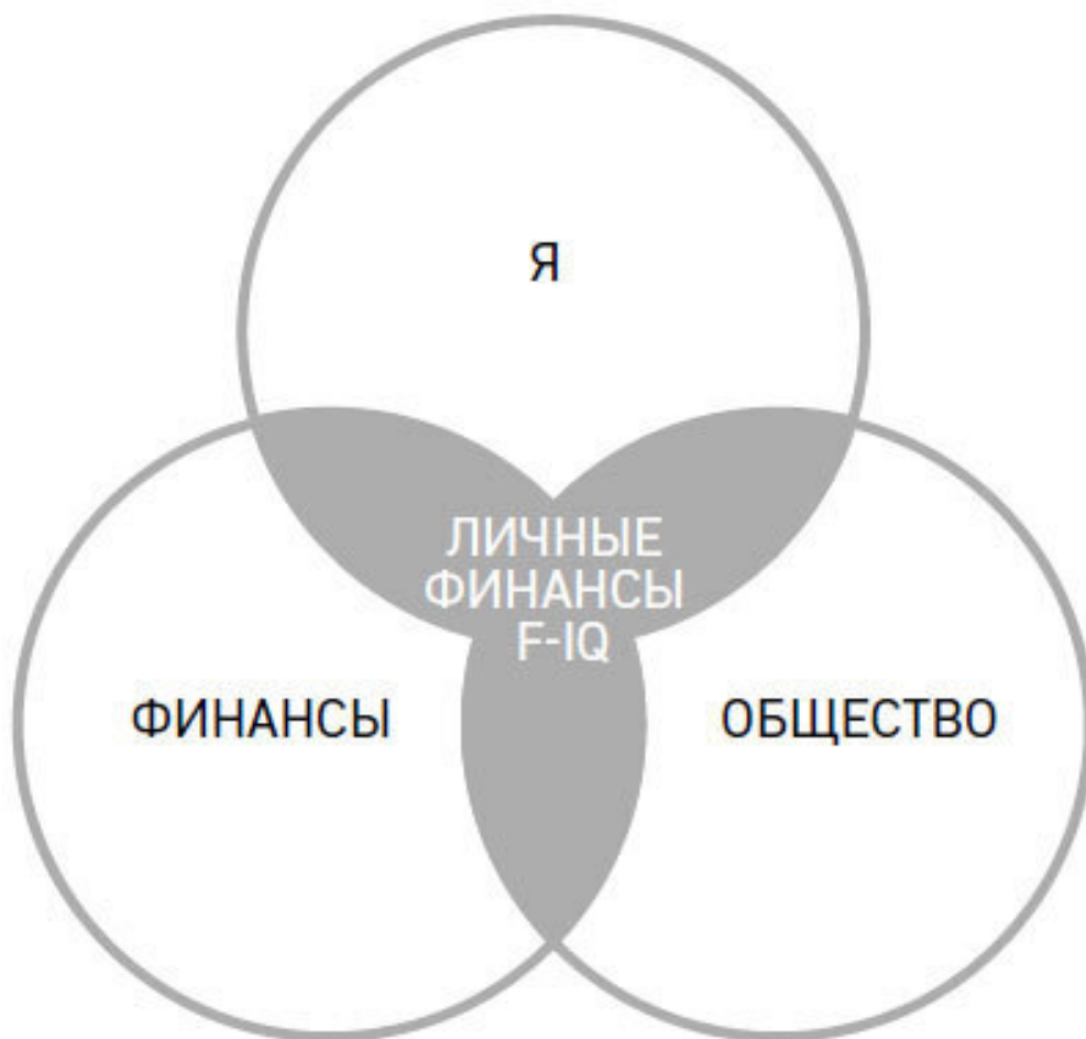
Рисунок 1. Три системы: личность, общество, деньги

Меня как профессионального психолога и финансового эксперта поразила однобокость и предвзятость большинства книг, посвященных финансовой грамотности и накоплению богатства. Все эти книги содержат множество советов, но почти не отвечают на самые насущные вопросы. Авторы, как правило, делятся тем, в чем они сами преуспели, и будто забывают об