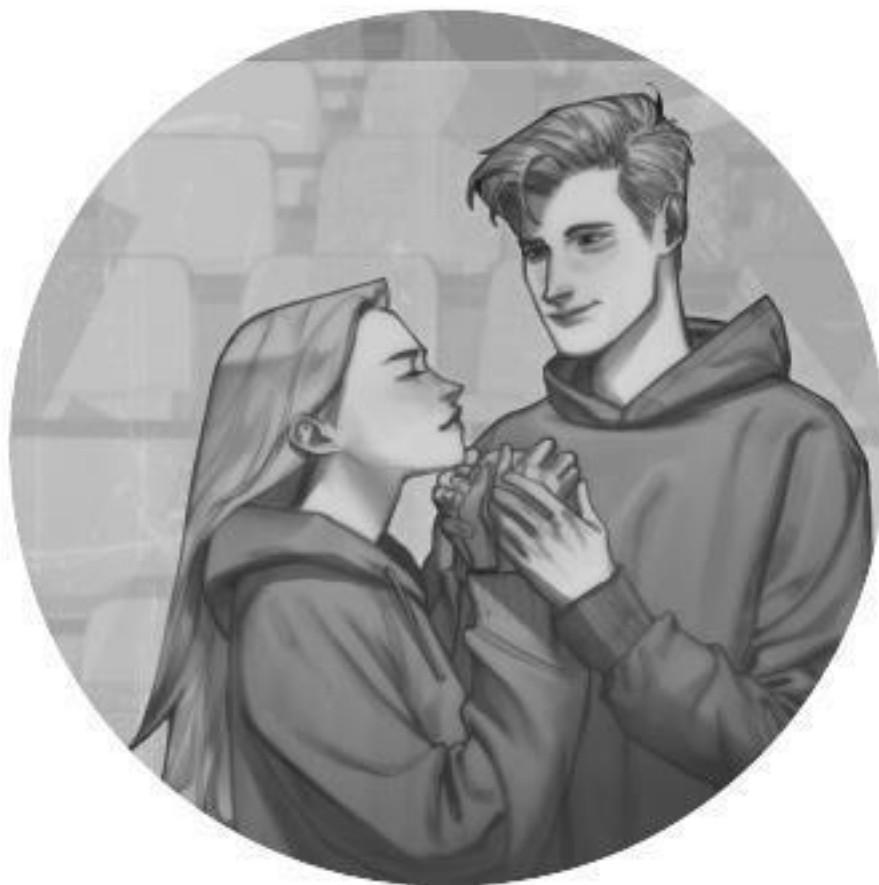
Иллюстрация на обложке LINK

Во внутреннем оформлении использованы иллюстрации: