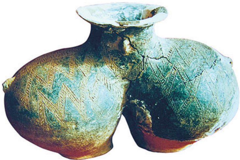
Фаянсовая керамика, найденная в руинах близ Каруба

Кроме того, были обнаружены кости более 10 видов животных (таких, как свинья, антилопа и сибирская косуля), запасы пшеницы, а также 27 каменных жилищ с печами и погребками. Археологи считают, что постройки в Карубе могли быть сделаны 4 тыс. лет назад, и это служит доказательством того, что человек в Тибете стал вести оседлый образ жизни, а его производственная деятельность расширилась от охоты до сельского хозяйства. Считается, что эта примитивная деревня просуществовала не менее тысячи лет и имела такой же уровень развития культуры, как Мацзяю, Бань-Шань и