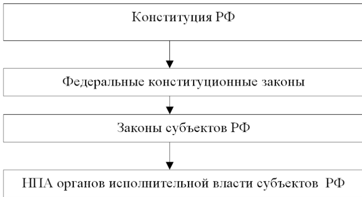
Рис. 2. Правовое регулирование предметов совместного ведения РФ и субъектов РФ