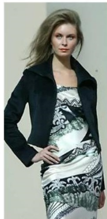
Модели вечерней одежды