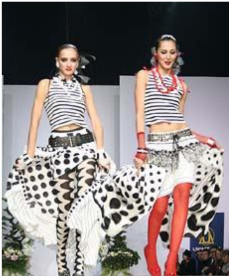
Коллекция весна–лето 2006