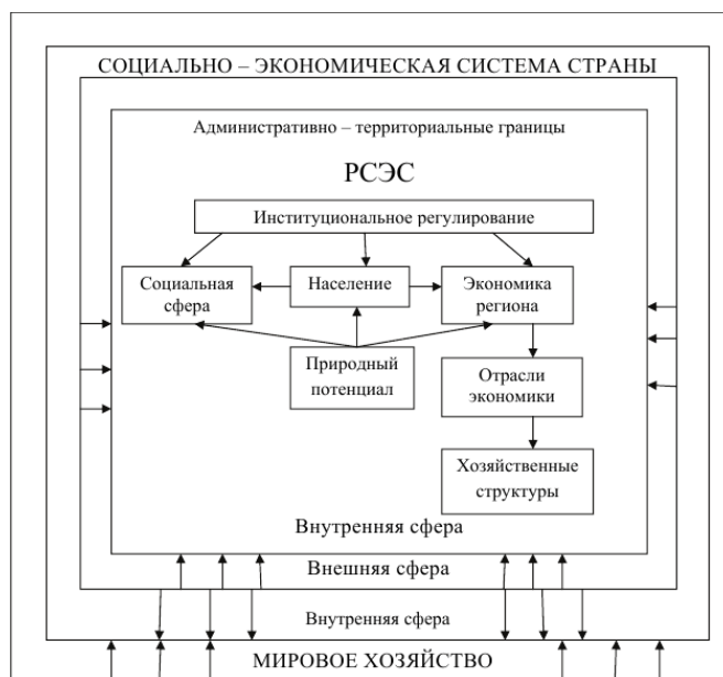
Рисунок 2 – Аспекты позиционирования и структуры региональной социально-экономической системы (*составлено авторами)

Структурная многообразность РСЭС требует применения методов системного анализа «при выборе региона в качестве субъекта хозяйствования», делая акцент на изучении таких процессов как «экономическая целостность территории, хозяйственного комплекса, характера внутренних и внешних экономических связей, общности экономических, социальных и общественно-политических задач, решаемых на территории, возможности эффективного управления территорией» [169].