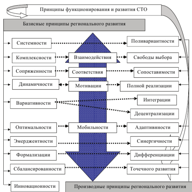
Рисунок 4 – Классификация принципов функционирования РСЭС

2. Производные принципы функционирования системных территориальных образований, сложившиеся в результате эволюционного развития и учитывающие особенности развития территорий.