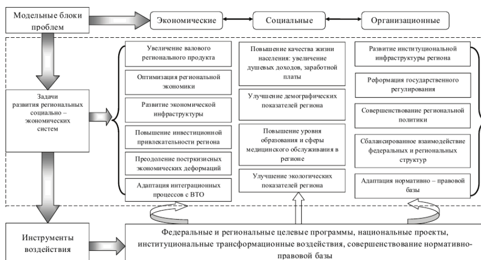
Рисунок 3 – Классификация проблем функционирования, задач развития региональных социально-экономических систем и инструментов целенаправленного воздействия

валового регионального продукта, повышение качества жизни населения и развитие институциональной инфраструктуры).