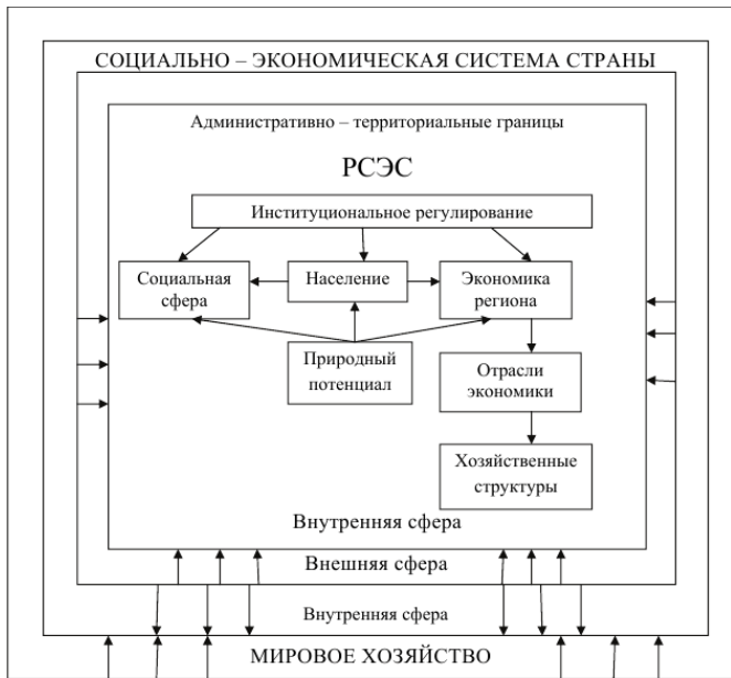
Рисунок 2 – Аспекты позиционирования и структуры региональной социально-экономической системы (*составлено авторами)

Структурная многообразность РСЭС требует применения методов системного анализа «при выборе региона в качестве субъекта хозяйствования», делая акцент на изучении таких процессов как «экономическая целостность территории, хозяйственного комплекса, характера внутренних и внешних экономических связей, общности экономических, социальных и общественно-политических задач, решаемых