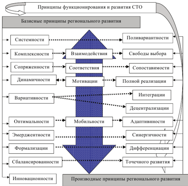
Рисунок 4 – Классификация принципов функционирования РСЭС

Принцип системности относится к группе диалектико-материалистических принципов и основан на методологическом подходе к анализу каких-либо процессов, который рассматривается как некоторая система, структурно состоящая из отдельных элементов, но не равная алгебраически их сумме. Свойства элемента определяются его местом в структуре. Базовым данный принцип является ввиду своей распро-