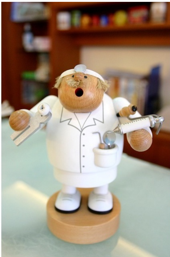
кукла зубной врач