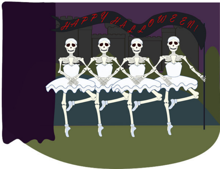
хеллуин балет скелеты

То ли есть на самом деле, То ли плод воображенья Эти инопланетяне Из другого измеренья?