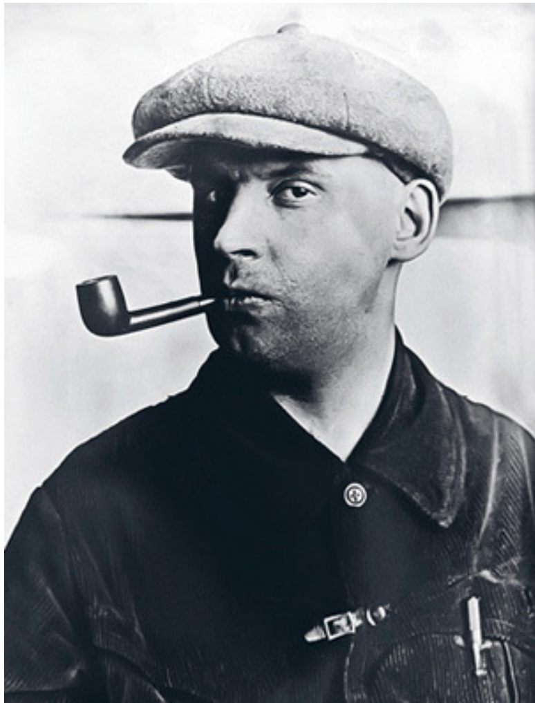
Александр Родченко с трубкой.