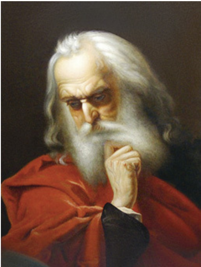
Виталий Бороздин. Копия с картины Йохана Кёлера «Галилео Галилей». 1904. Мстёрский художественный музей. Публикуется впервые