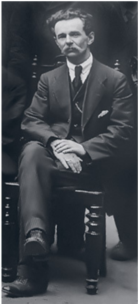
Николай Сычѳв. 1919. Собрание Ирины Кызласовой, Москва