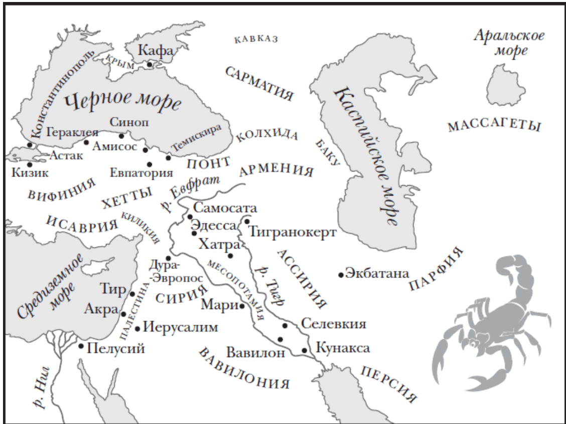
Карта 3. Малая Азия, Ближний Восток, Месопотамия и Парфия. Автор карты – Мишель Эйнджел