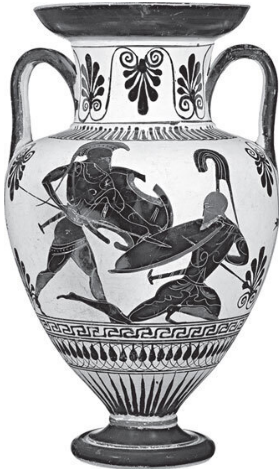
Рис. 1. Героическая битва гоплитов: сражение одинаково экипированных греческих воинов с конвенциональным оружием – копьями и щитами. Аттическая чернофигурная амфора, 500–480 гг. до н. э. Музей Дж. Пола Гетти.

Какой бы страшной ни выглядела эта бойня, именно такой картины ожидали воины и их командиры. Хорошо вооруженный и экипированный солдат упражнялся для битвы, готовился к сражению и осознавал риск смерти; он без колебания шел в схватку и бился с врагом лицом к