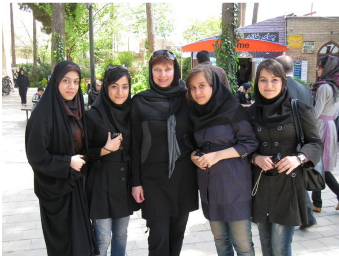
Так женщины одеваются в Иране

Пить спиртные напитки в Иране категорически запрещено. Сказать честно, и не тянет, наверное, потому, что когда нет соблазна, нет и соблазненных. Там можно купить безалкогольное пиво, но по вкусу оно, в основном, напоминает наш лимонад. За употребление наркотиков можно вообще больше не строить планов на жизнь.