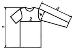
Рис. 1.1 Футфайка