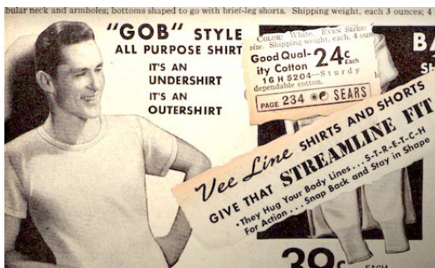
Рис 1.2. Реклама белья двойного назначения в газете 40-х годов. Текст рекламного сообщения: Универсальная рубашка, крой – «тельняшка». Это и нательное белье и повседневная рубашка.

ники начали даже выпускать футболки армейского фасона с воротом Crew neck для гражданского населения.