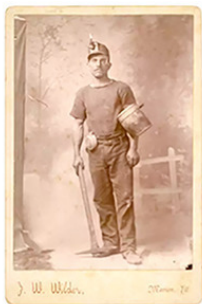
Рис. 1.1. Фотография шахтера начала XX-го века [3].

Такая одежда не стесняла движений во время работы, защищала тело от пыли и жары, а при ношении в качестве нижней рубашки дополнительно согревала и предохраняла верхнюю одежду от пота.