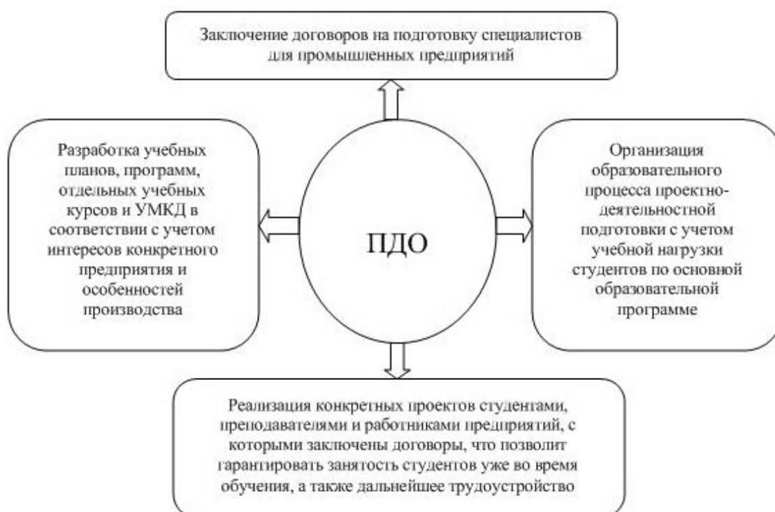
Рис. 1.1. Процесс проектно-деятельностного обучения

Наиболее полно удовлетворить требования работодателей к уровню подготовки кадров позволяет проектно-деятельностное обучение, являющееся перспективной технологией повышения конкурентоспособности, которое схематично представлено на рис. 1.1. Оно способствует переориентации образовательного процесса, в котором студент из пассивного потребителя знаний становится активным субъектом образовательной и научно-исследовательской деятельности и обеспечивает формирование у выпускников общих и профессиональных компетенций.