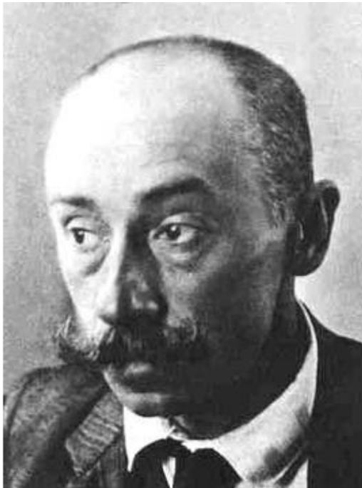
Константин Фёдорович Богаевский, фото

Создано в интеллектуальной издательской системе Ridero