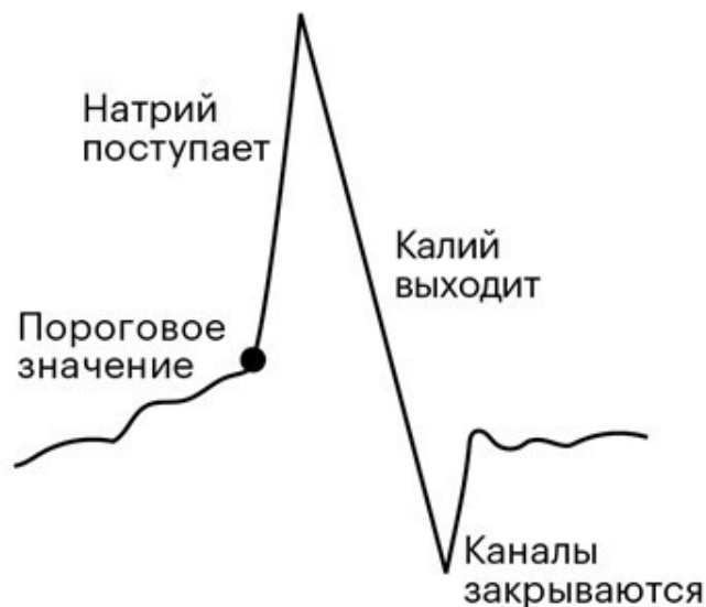
Рисунок 2.2. Импульс. Электрический потенциал (толстая черная линия) на мембране нейрона нарастает, пока не достигнет критической точки. Это запускает лавинообразное открытие каналов в мембране, ионы устремляются внутрь и затем наружу, потенциал быстро повышается, а затем так же стремительно снова падает вниз, прежде чем вернуться к нормальному состоянию. Весь процесс занимает около миллисекунды.

Мучая аксон кальмара в ванночке с соленой водой, ученые открыли процесс рождения импульса (рис. 2.2). Когда потенциал на мембране нейрона превышает критическое значение, в ней лавинообразно открываются ионные каналы, через которые могут проходить только ионы натрия. Они устремляются внутрь клетки, быстро увеличивая там свою концентрацию и вызывая всплеск напряжения на мембране. Но это продолжается недолго, поскольку повышение концентрации ионов натрия вызывает открытие других каналов, пропускающих ионы калия, которые перекачиваются наружу, отправляя положительный заряд обратно почти так же быстро, как он поступает внутрь с ионами натрия. В свою очередь этот выброс калия закрывает каналы для натрия, поток ионов прекращается, и так же быстро, как оно росло, напряжение снова падает до отрицательных значений. Этот быстрый рост, а затем резкое падение напряжения и есть импульс.