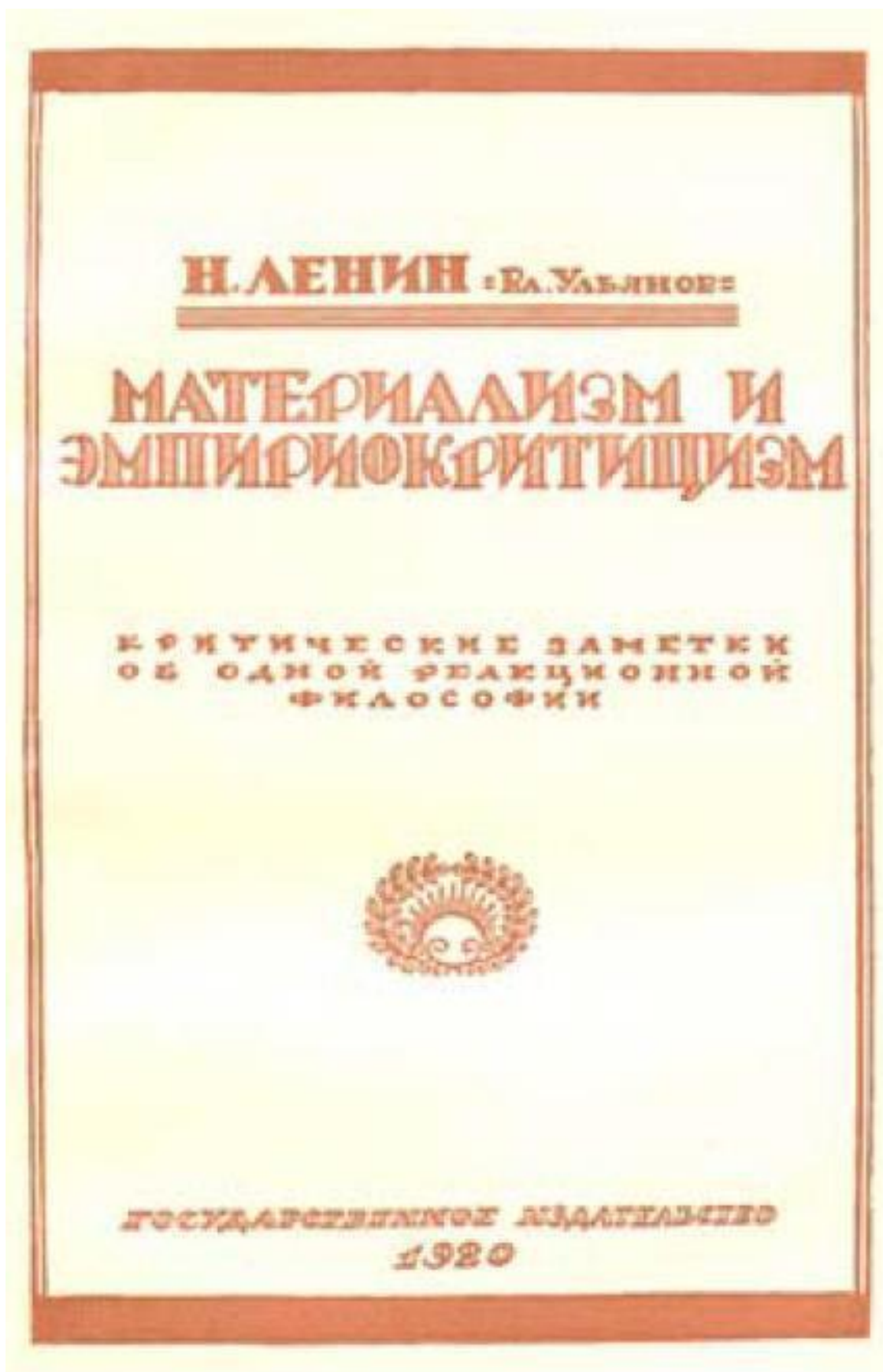
Обложка второго издания книги В. И. Ленина «Материализм и эмпириокритицизм». – 1920 г.