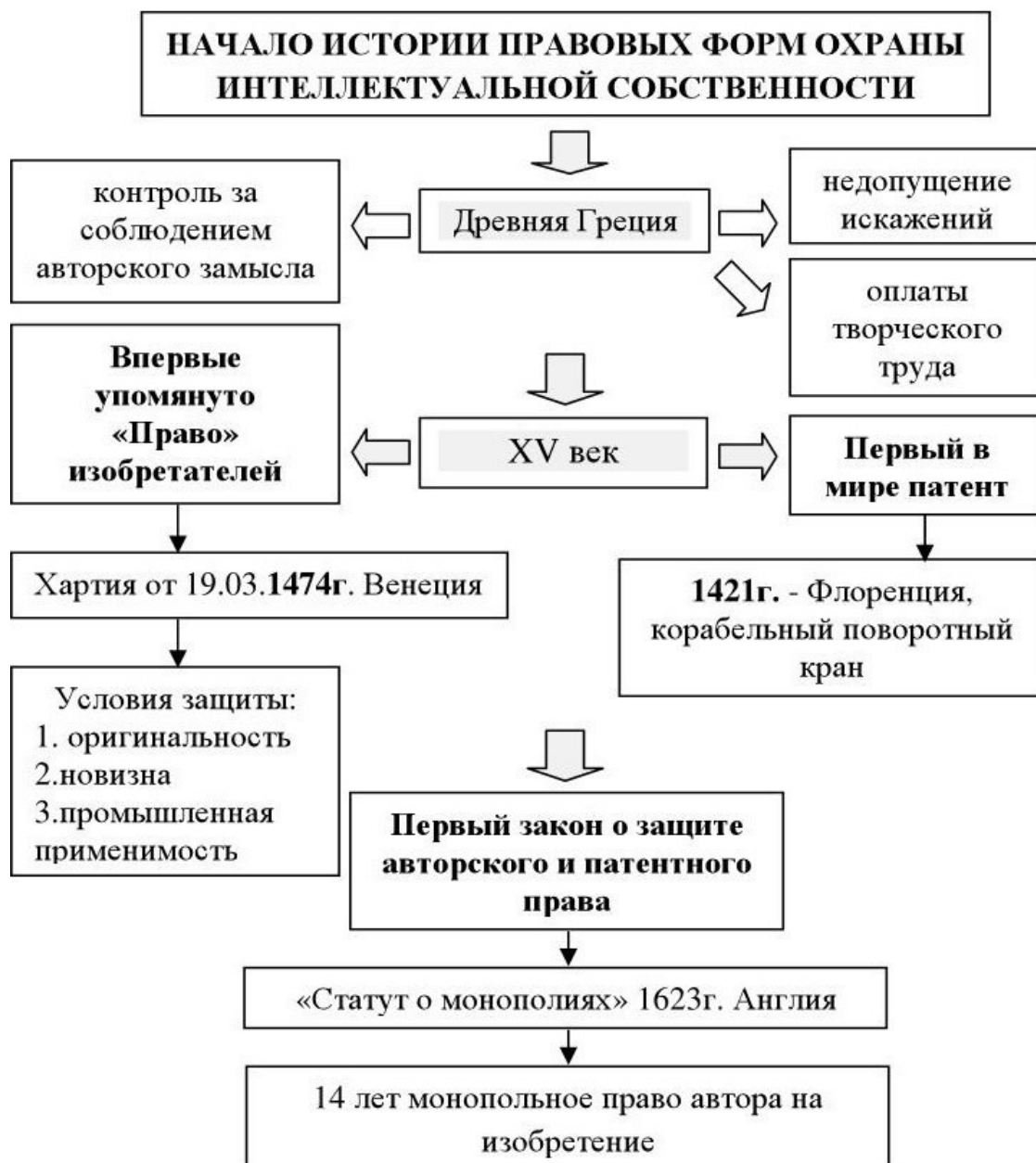
Рис. 1. История развития правовых форм охраны интеллектуальной собственности

В связи с этим возникла необходимость закрепить «частную собственность» на достижения искусства и технические новации. Издание книг и внедрение изобретений всегда требовали затрат максимальных средств и усилий именно от того, кто делал это первым. Ему же приходилось оплачивать и труд авторов. Конкуренты не несли расходов, связанных с подготовительной стадией, и могли предложить публике тот же товар по более низким ценам. До возникновения патентного права каждый мог воспользоваться изобретением, сделанным другим. В результате ни создатель произведения, ни издатель, ни творец технических новшеств, ни тот, кто оплачивал его труд, часто не получали никаких экономических выгод от своей деятельности. Такое положение было серьезным тормозом технического прогресса, препятствовало распространению культурных ценностей. Наиболее важной задачей было четкое определение того, что принадлежит одному лицу, а что другому; кто и на что имеет право. Решение этой задачи могло обеспечить только государство.