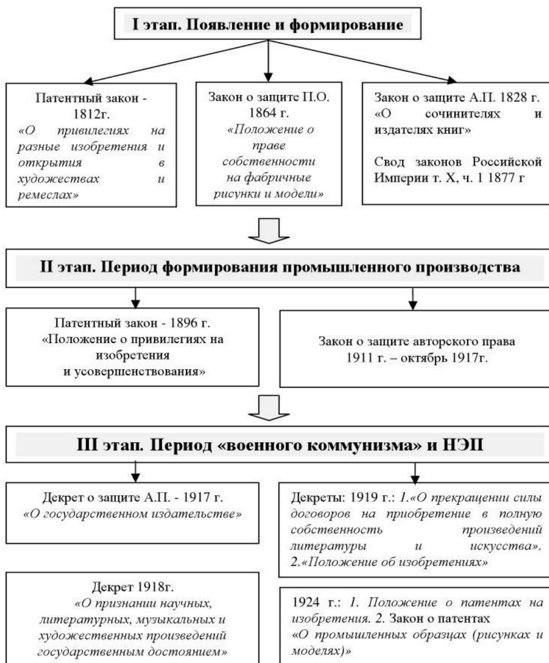
Рис. 2. I – III этапы развития правовых форм охраны интеллектуальной собственности в России