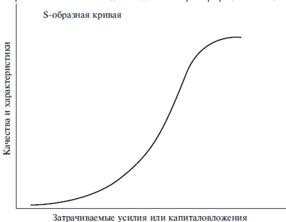
Рис. 1.1. Типичный вид так называемой S-образной (сигмоидной) кривой развития

общий процесс роста замедляется, а затем и почти прекращается, что свидетельствует о достигнутой «зрелости» технологии или изделия. В дальнейшем рост прекращается вообще.