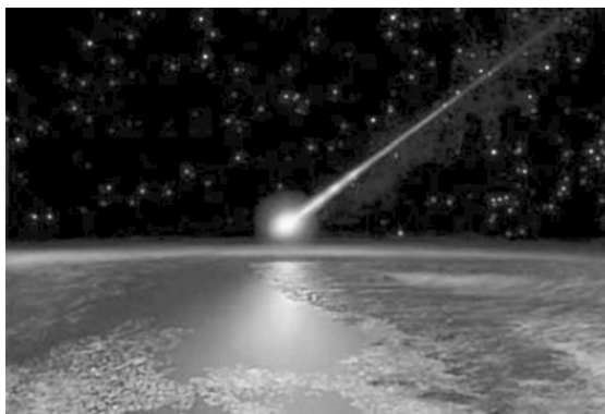
Рис. 1.3. Доставка воды на землю