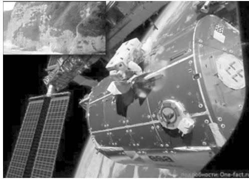
Рис. 1.4. Живые организмы в открытом Космосе

1. Способ возникновения жизни на твердой планете, включающий формирование космического объекта, состоящего из воды в виде льда, столкновение космического объекта с твердой планетой, отделение от твердой планеты фрагмента с противоположной стороны от места ее взаимодействия с космическим объектом, захват фрагмента твердой планеты силами гравитации твердой планеты с обеспечением его орбитального движения вокруг твердой планеты, термическое воздействие на космический объект, его таяние, доставка предбиологической фазы жизни на твердую планету и развитие предбиологической фазы жизни в результате циклических температурных процессов, а также циклических приливов и отливов, связанных с гравитационными силами фрагмента твердой планеты, движущегося по ее орбите.