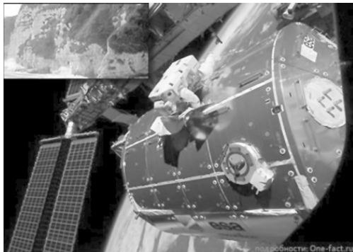
Рис. 1.4. Живые организмы в открытом Космосе