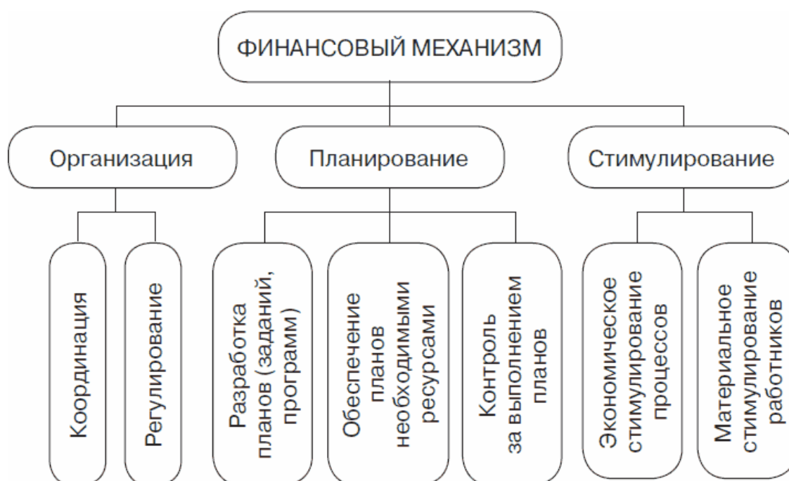
Рис. 4. Финансовый механизм 21

Количественная определенность проявляется в сумме ресурсов, выделяемых на те или иные цели, что является основой функционирования финансового механизма, так как без соответствующих ассигнований невозможно решение каких-либо задач по развитию общества. Одновременно важно и то, каким образом осуществлялось формирование предоставляемых финансовых ресурсов, в каких формах и по каким каналам происходило их движение, на каких условиях они выделялись и использовались. Это характеризует качественную определенность действия финансового механизма.