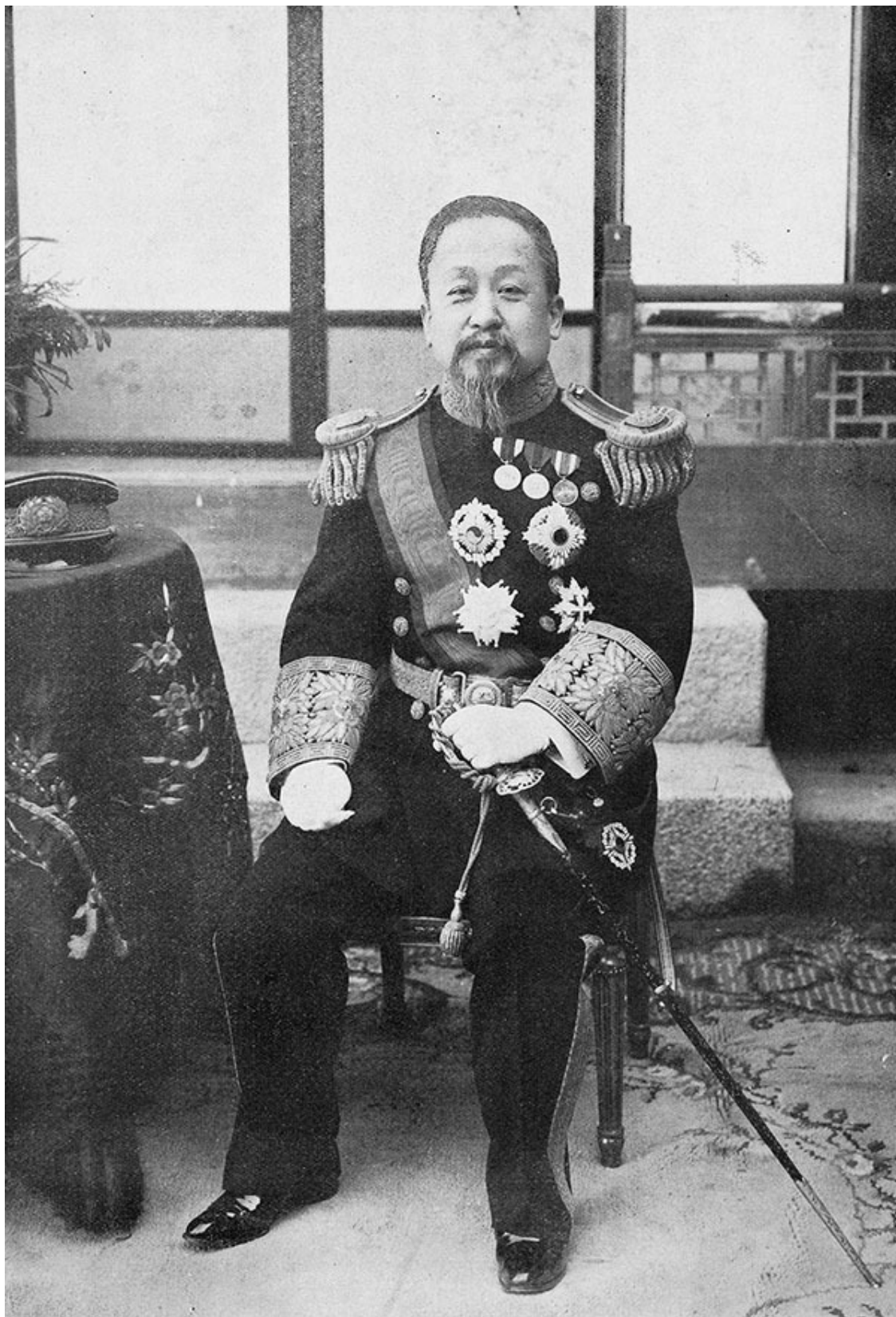
Коджон – первый император Кореи. Фото 1897 г.

Тем не менее, несмотря на такое неоднозначное положение, Корея в это время начинает заявлять о себе на международной арене: открывает учебные заведения западного образца, модернизирует промышленность и армию.