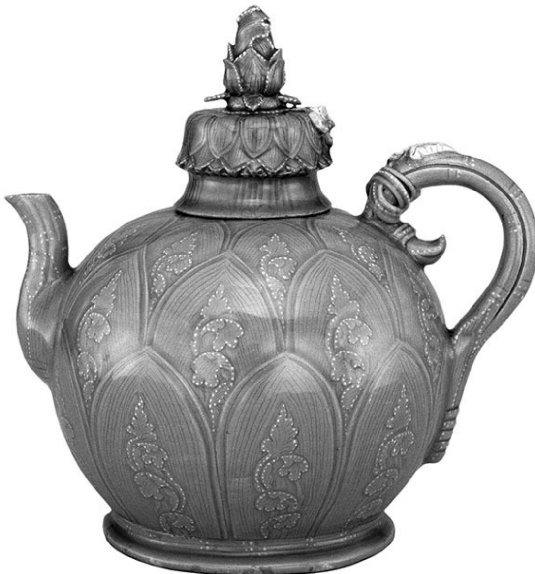
Керамический чайник периода Корё. 1-я пол. XII в.

Дин Юньпэн. Мастера трех философий (Конфуций, Лао-Цзы и Будда). 2-я пол. XVI – нач. XVII в.