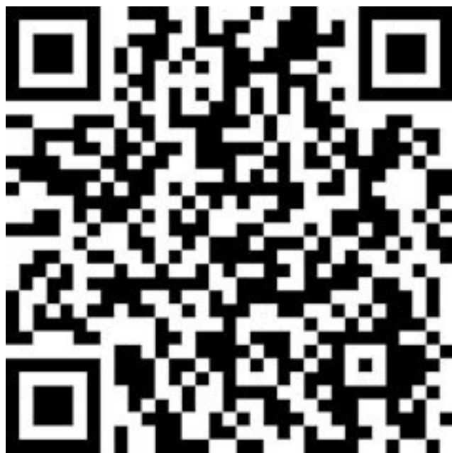
Желтый император Хуан-Ди. Изображение из книги «Очерки китайской истории». 1914 г.

Существование «автора» даосизма – Лао-Цзы – ставится историками под сомнение, как и существование основателей многих других религиозно-философских течений. Либо это мог быть собирательный образ сразу нескольких проповедников нового учения. Именно с даосизмом обычно связывается концепция «инь и ян», единства и борьбы противоположностей: солнце и тьма, день и ночь, добро и зло, земля и небо. Но вполне возможно, что ее происхождение – значительно более древнее. Инь и ян – едины и неделимы, их единство предопределяет гармонию и в то же время изменчивость мира. Инь – женское начало, ян – мужское. Инь – земля, ян – небо, инь – луна, ян – солнце, инь – покой, ян – движение. Одно начало никогда не сможет победить другое, да в принципе и не должно это делать, ведь черное не может существовать без белого, а лето – без зимы. Впрочем, к теории инь и ян мы еще вернемся, когда будем говорить о корейской системе мира и понятиях о гармонии.