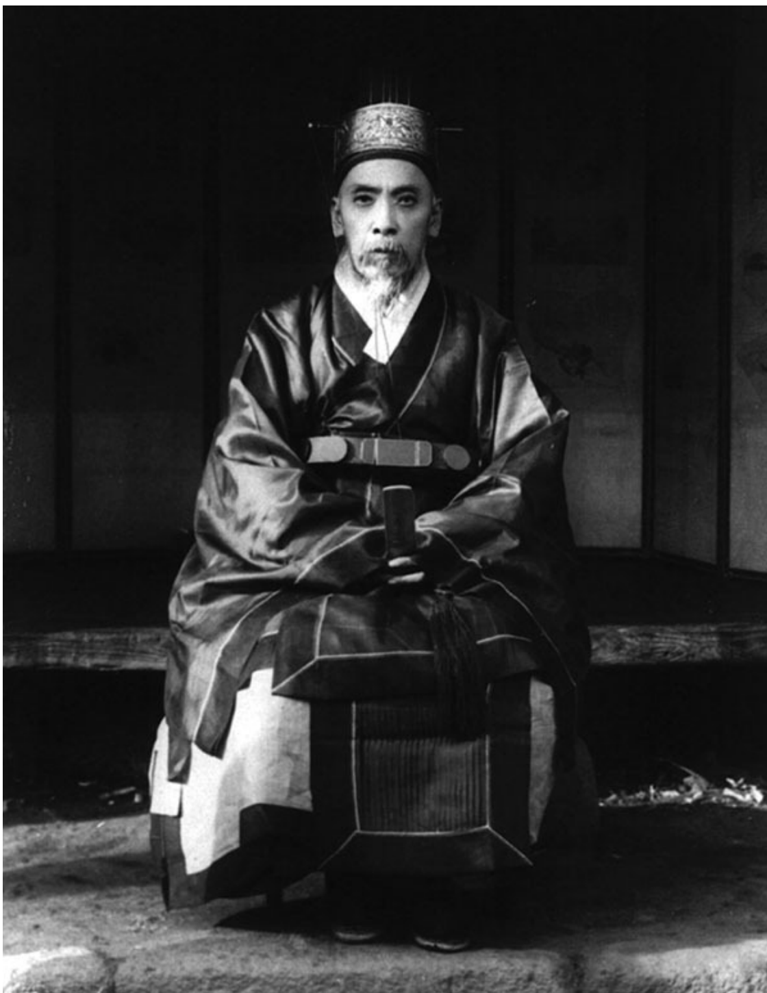
Представитель корейской знати. Фото 1910 г.

Есть версия, что сказочные сюжеты, в которых герой проходит всевозможные испытания, – это отражение древнейших обрядов инициации, посвящения. Например, когда мальчик становится взрослым мужчиной, удачно пройдя испытания на охоте.