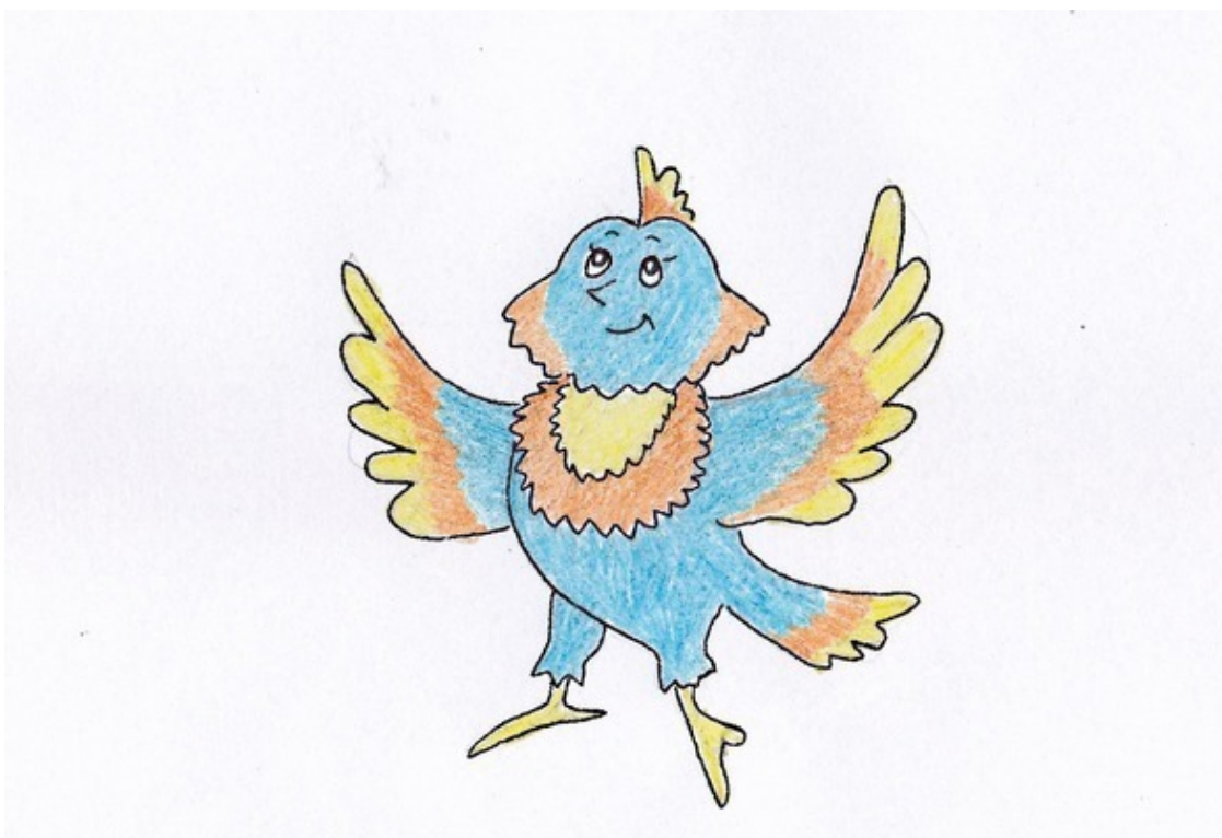
Превращение Паука в Пау. Рис. А. Дубровиной

Вот последний просвет между паутинками закрылся перед глазами Паука, и он заснул волшебным сном.