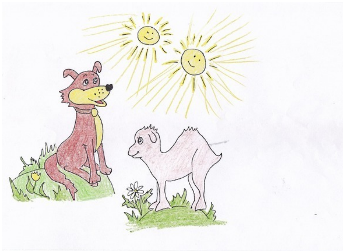
Пёс Бак и Верблюжонок Ликки. Рис. А. Дубровиной

– Ой-ой-ой! – Пёс Бак барахтался в воздухе, стараясь затормозить падение. В конце концов, он принял позу птицы, повинаясь голосу интуиции, и движение замедлилось, вопреки законам мира, из которого прибыл наш герой.