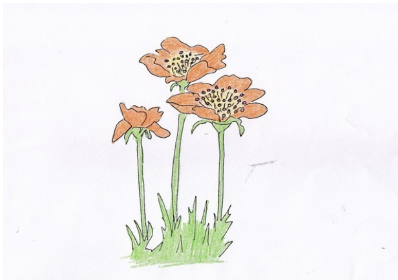
Рис. А. Дубровиной

Волшебный Лес готовился встретить новых гостей, вернее, новых учеников. Он с любовью подбирал для них «учителей», которые пока и сами-то не подозревали, что будут кого-то учить. Их встреча произойдёт «случайно», как всегда.