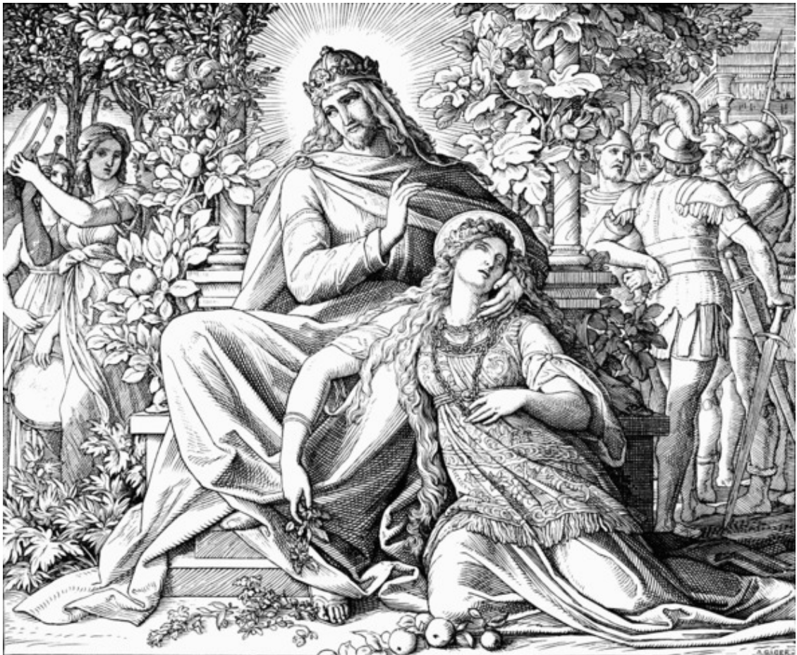
Юлиус Шнорр. Песнь песней

Скажи мне, возлюбленный души моей, где пасешь ты, где делаешь привал со стадом твоим в полдень? Зачем мне скитаться под покрывалом возле стад.