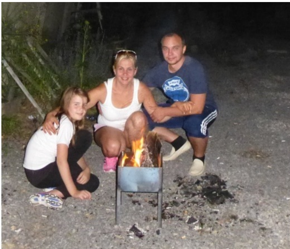
Мои папа и мама

Я очень люблю путешествовать. Путешествие – это время, которое я провожу с любимыми папой и мамой. «Всегда следовать своей мечте», – говорит мама. Она любит цитировать выражение: «Не говори мне, насколько ты образован – просто скажи, сколько ты путешествовал».