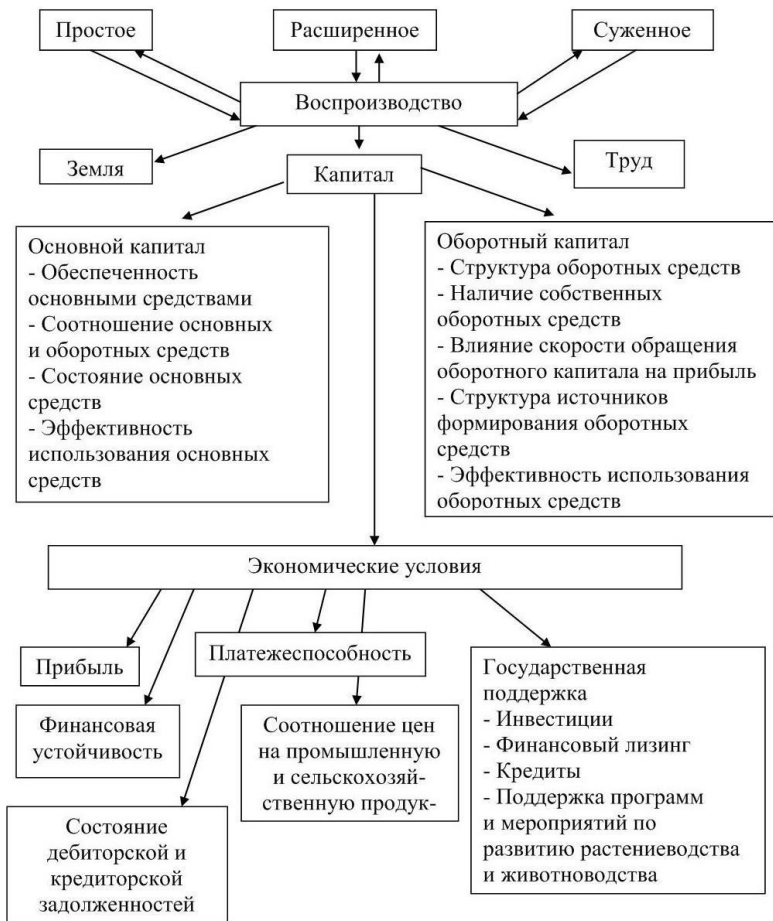
Рисунок 2 – Экономические условия воспроизводства в сельскохозяйственных организациях