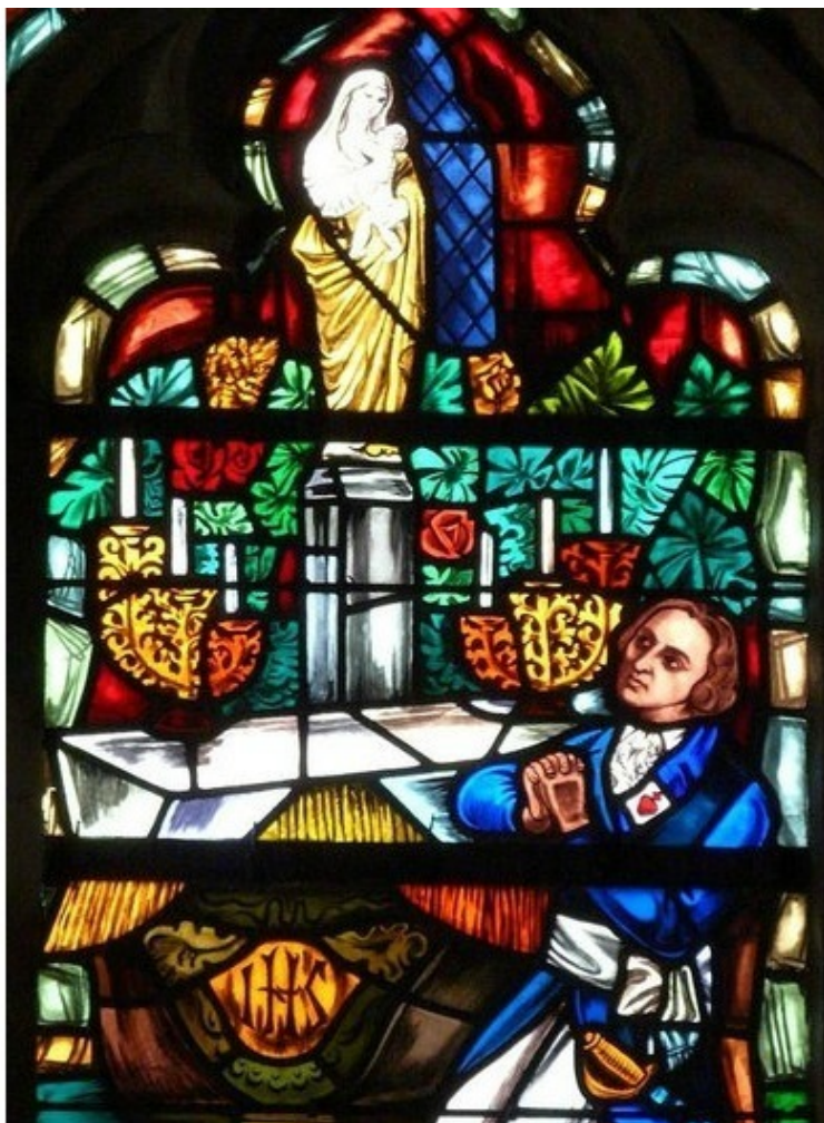
Мариньи на молитве

13 мая, Мариньи принимает участие в взятии Ла Шатеньере. Гарнизон города состоял из 3000 республиканцев, вандейцев же было 8000. После двухчасового боя, синие отступили в Фонтене. Победителям досталась вся артиллерия противника и множество ружей и боеприпасов.