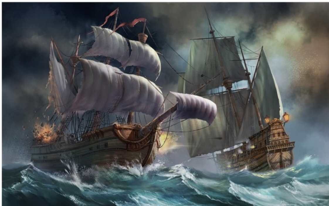
морское сражение XVIII век