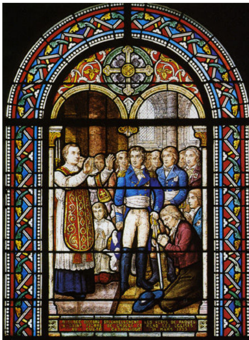
вандейцы в церкви

Итак, взятие или можно сказать освобождение Фонтене, отдало под власть роялистов территорию семи дистриктов с населением больше чем 200 000 человек, которые нуждались в управлении. И поэтому, 26 мая в Фонтене был создан «большой административный совет по управлению территориями, освобожденными во имя Людовика XVII». Куда кстати вошел и Мариньи. Первым актом этого совета, было публикация знаменитого манифеста, адресованного всем французам от имени военачальников Королевской и Католической Армии, датированного 27 мая 1793 года.