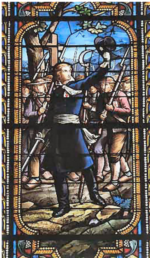
Анри де Лярошжаклен

И 13 апреля с отрядом вооруженным в основном палками и косами, на 2000 человек всего 200 ружей, захватывает Обье. С бою взято две кулеврины, 1200 армейских ружей и несколько бочонков с порохом. За Обье следует Шатильон и Тиффонс. 30 апреля, Великая Королевская и Католическая Армия берет Шоле, на другой день взят Шалоне. Ряды повстанцев растут и уже объединенные силы вандейцев числом 25 000 человек идут на штурм Брессюира. Революционное командование решает сдать город и эвакуируется под мощные городские стены Туара. 2 мая роялисты вошли в город. Дониссаны, Лескюры и Мариньи оказались на свободе, они возвращаются в замок Клиссон. На пол – дороги их догоняет Анри во главе отряда кавалеристов и сопровождает до Клиссона.