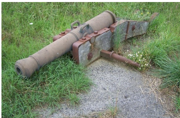
одна из пушек вандейцев