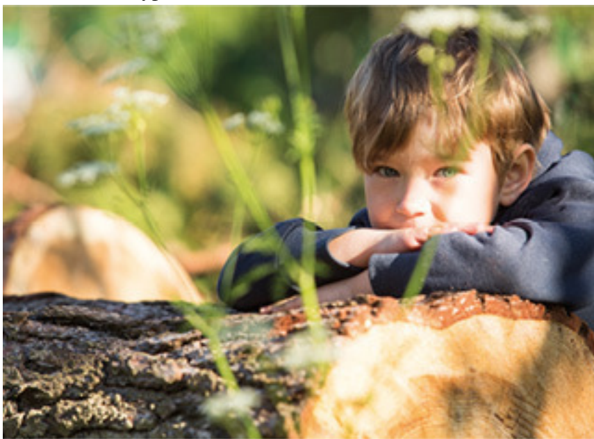
Мальчик, который боялся любить

Много свечей в церкви надо, ведь этот огонь путь к Богу освещает сквозь темный лес разных жизненных буреломов.