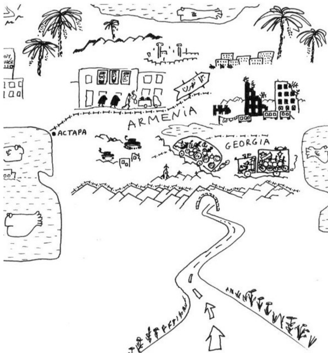
Первая часть путешествия, до Ирана (схема)