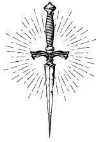
Иллюстрация на обложке Karna Virtanen