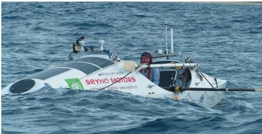
Лодка «Тургояк» – прибытие в Австралию. Май 2014 года

В этой книге я расскажу о, пожалуй, самой экстремальной и технологически сложной экспедиции. События июля 2016 года навсегда войдут в историю мирового воздухоплавания. Возможно, пройдут десятилетия, прежде чем рекорды Фёдора Конюхова, установленные на воздушном шаре «Мортон», будут улучшены и побиты. Российскому пилоту удалось справиться с чередой невероятных испытаний, и с первой попытки он установил сразу два мировых рекорда, впоследствии ратифицированных Международной авиационной федерацией (FAI) и зарегистрированных Книгой рекордов Гиннеса: самый быстрый кругосветный полёт на воздушном шаре и наибольшее расстояние, пройденное пилотом-одиночкой.