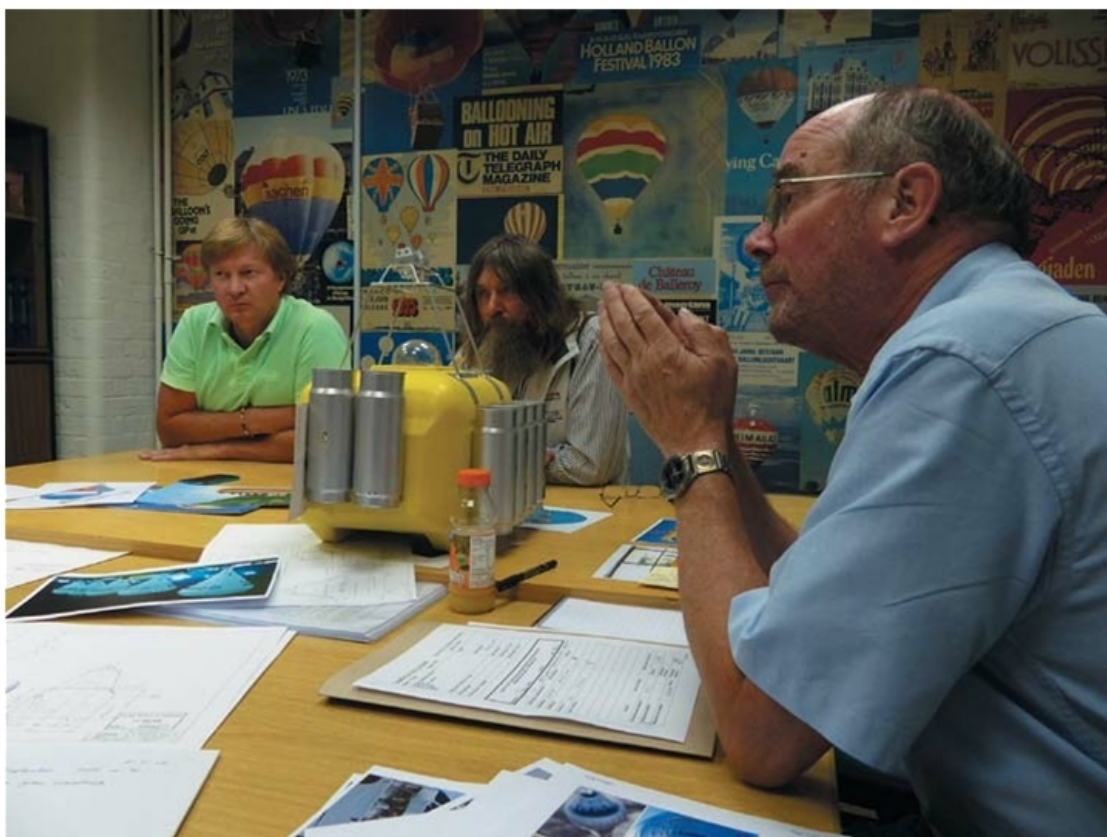
Обсуждение проекта будущего аэростата

В документальном фильме «Повелитель ветра» кинорежиссёра Фёдора Бондарчука есть эпизод, когда на старте Фёдора спрашивают: «Резать верёвку?» Он отвечает: «Резьте!» Стропы обрезают, и шар взлетает. Это как раз тот момент, когда англичане «выдохнули»: оболочка наполнена, газовые баллоны закреплены, аэростат набирает высоту... Что бы дальше ни случилось, теперь все процессы находятся в зоне ответственности пилота и его команды. Фраза «cut» («обрезай») знаменовала новую страницу в истории мирового воздухоплавания.