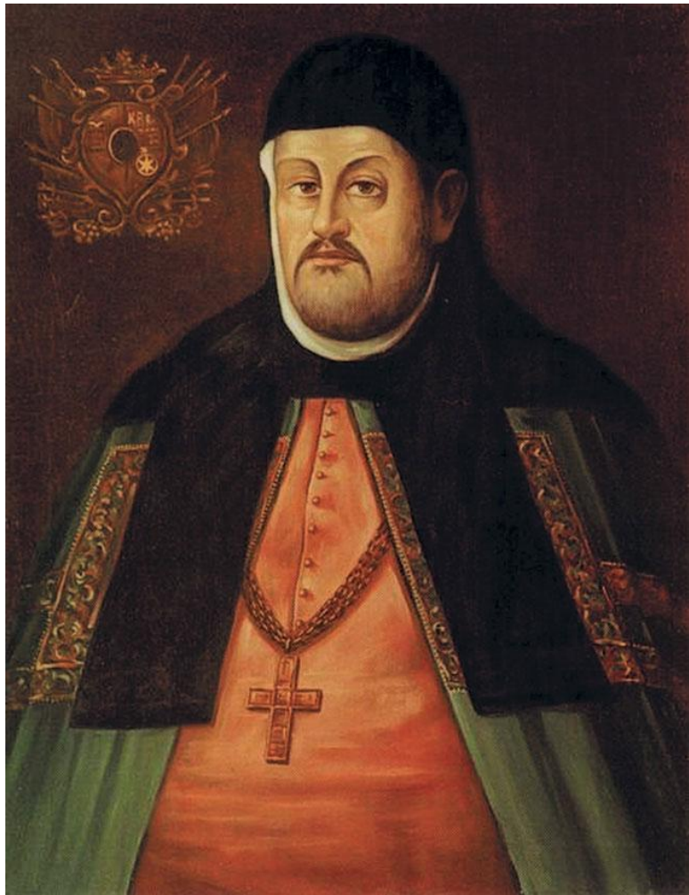
Неизвестный художник. Ипатий Потей. XVII в.