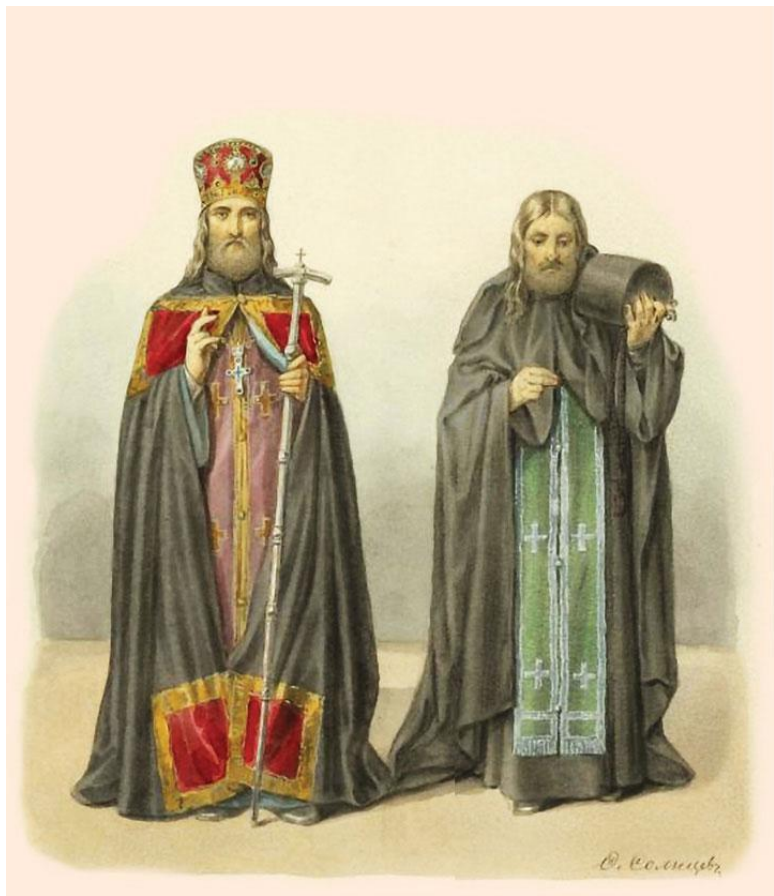
Ф. Солнцев. Архимандрит и иеромонах. Рисунок из книги «Древности Российского государства». Ранее 1853 г.

Не знаем, кто первый начал разговор об унии, Потей или