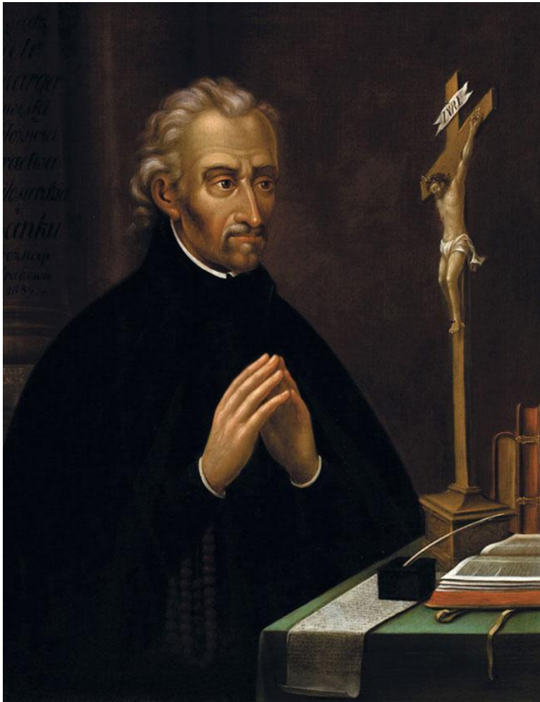
Неизвестный художник. Петр Скарпа. XVII в.