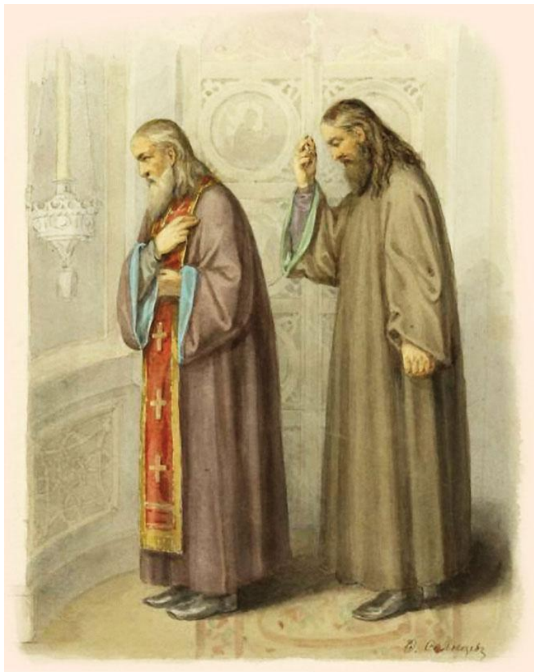
Ф. Солнцев. Священник и дьякон перед началом литургии. Рисунок из книги «Древности Российского государства». Ра-