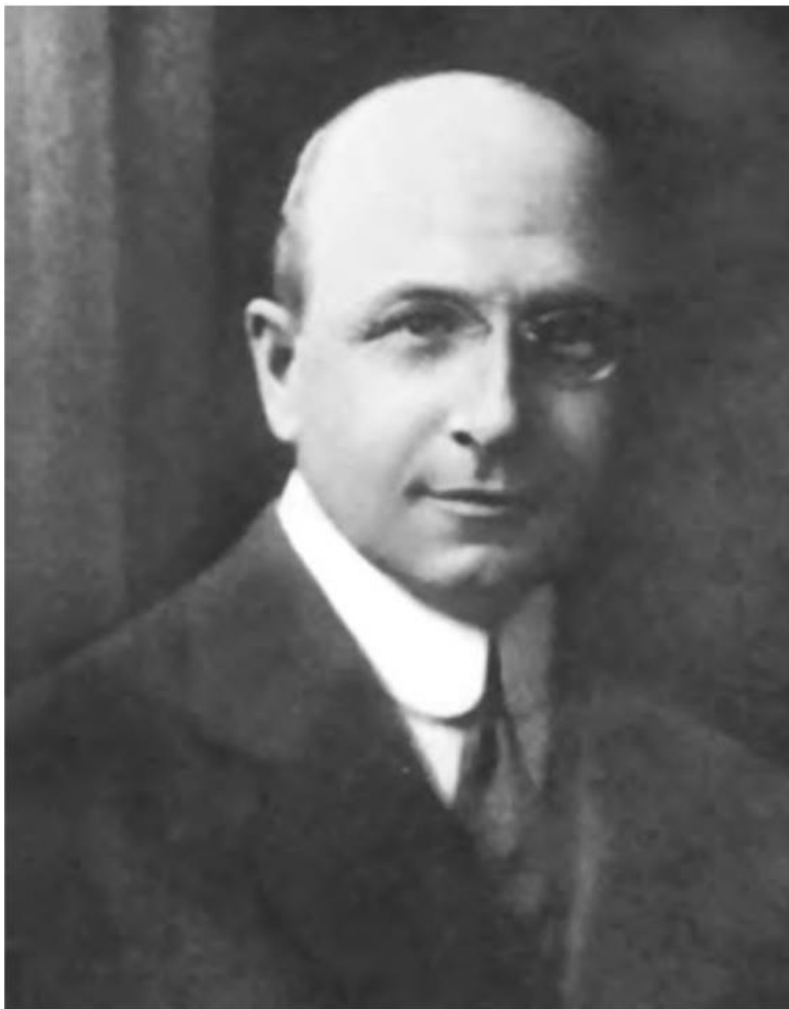
Рис. 1. А. Каррель, 1912

Микрохирургия – достаточно молодая область медицины и хирургии, в частности. Не прошло еще ста лет с того момента, когда обычный микроскоп был использован для хирургической операции. Это произошло в 1921 г. в Швеции. Карл-Олоф Нилен (Carl-Olof Nylen) (рис. 2) в эксперименте на кролике произвел фенестрацию свища лабиринта под микроскопом с увеличением 10 – 15 крат.