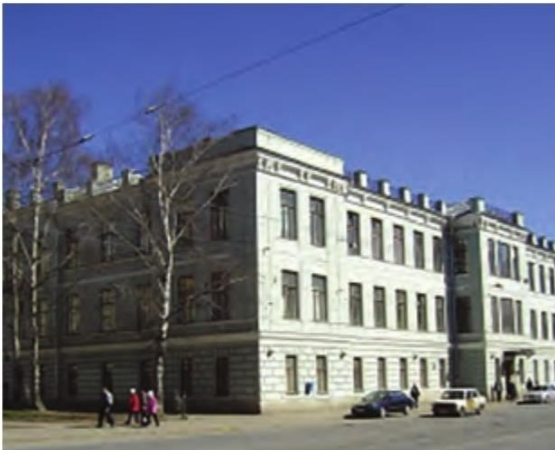
Рис. 5. Клиника военной травматологии и ортопедии Военно-медицинской академии, 2007

Пострадавшему была выполнена микрохирургическая операция: реvascularизация IV пальца (сшита одна собственная пальцевая артерия и восстановлен один собственный пальцевый нерв). Вены не восстанавливали, так как отчленение было неполное: венозный отток происходил через кожный лоскут на тыльной поверхности пальца. Операция проводилась под микроскопом фирмы «Carl Zeiss», шовным материалом Ethylon 10/0.