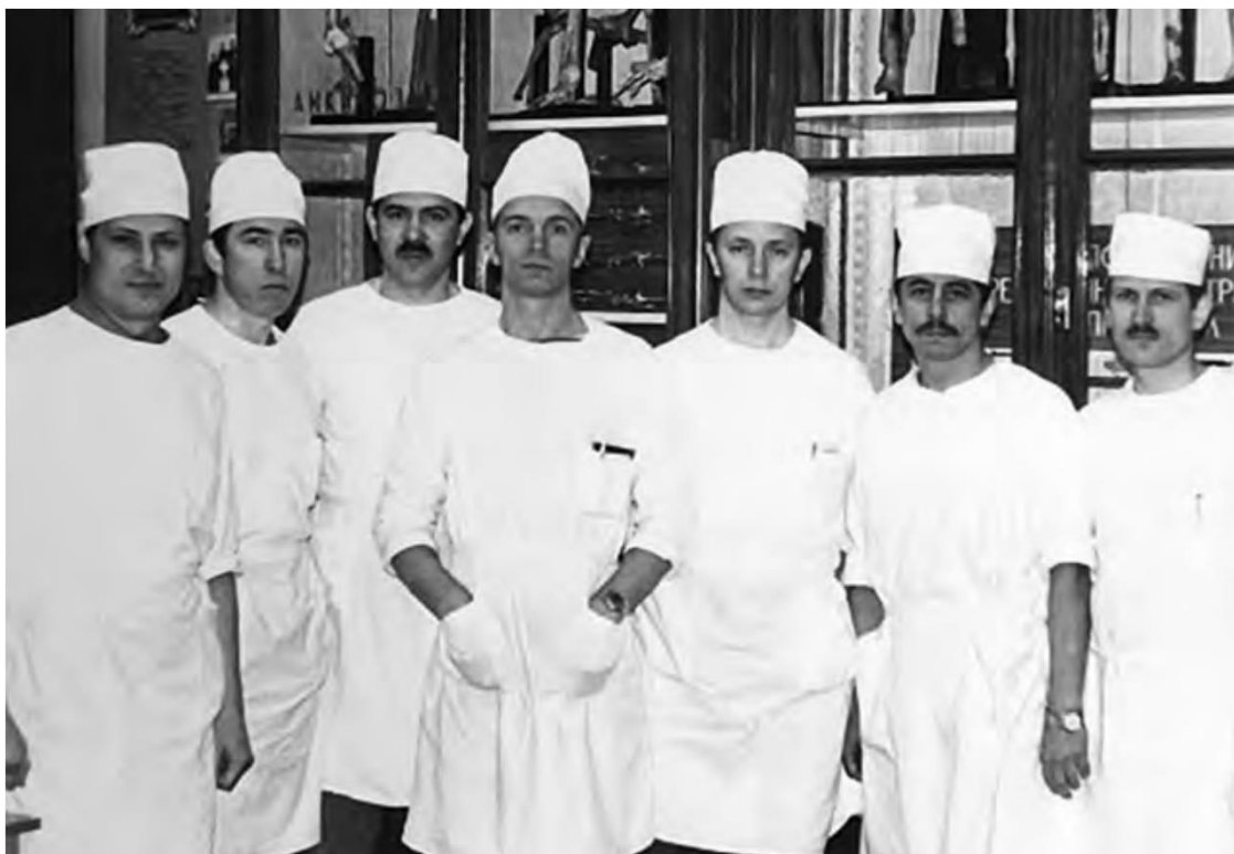
Рис. 6. Профессор А. Е. Белоусов (в центре) со слушателями первого выпуска микрохирургов

В 1984 г. профессором А. Е. Белоусовым была успешно защищена первая в СССР докторская диссертация по микрохирургии на тему: «Основные направления и перспективы использования микрохирургической техники при лечении больных травматологического профиля».