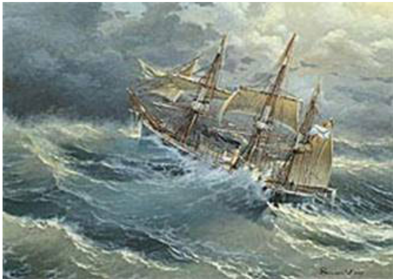
Гайдамак в океане. Орг., масло, 2008 г.