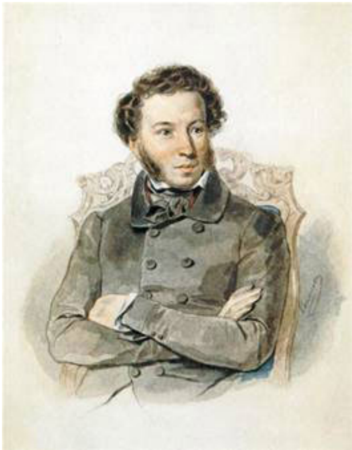
Портрет А. С. Пушкина, 1836

Пушкину приходилось бывать в его имении Лямоново,