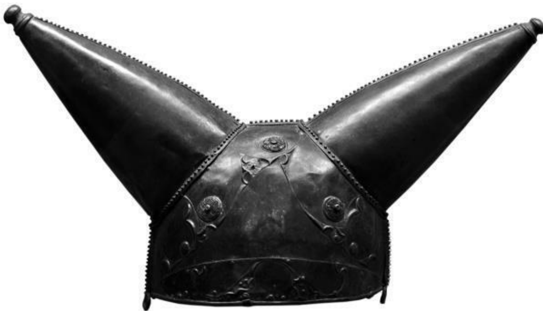
Шлем Ватерлоо. II–I в. до н. э.

Диодор Сицилийский писал: «На своих головах они носят бронзовые шлемы с большими выступающими частями, благодаря чему выглядят исполинами. Есть у них также шлемы с рогами и с изображениями различных животных». Что касается рогов, то археология не дает нам явных подтверждений словам Диодора. Кельтские шлемы могли быть довольно разнообразными по форме, но рогатых либо украшенных еще каким-то подобным образом обнаружено не так много. Например, в XIX столетии в Темзе неподалеку от моста Ватерлоо был найден кельтский шлем, украшенный двумя внушительными толстыми рогами. Благодаря месту нахождения его так и назвали – «шлем Ватерлоо». Но он изготовлен из тонкой бронзы, а судя по форме – не так уж плотно сидел на голове. Поэтому археологи предполагают, что этот шлем был предназначен скорее для каких-то обрядов, а не для сражений и устрашения врага.