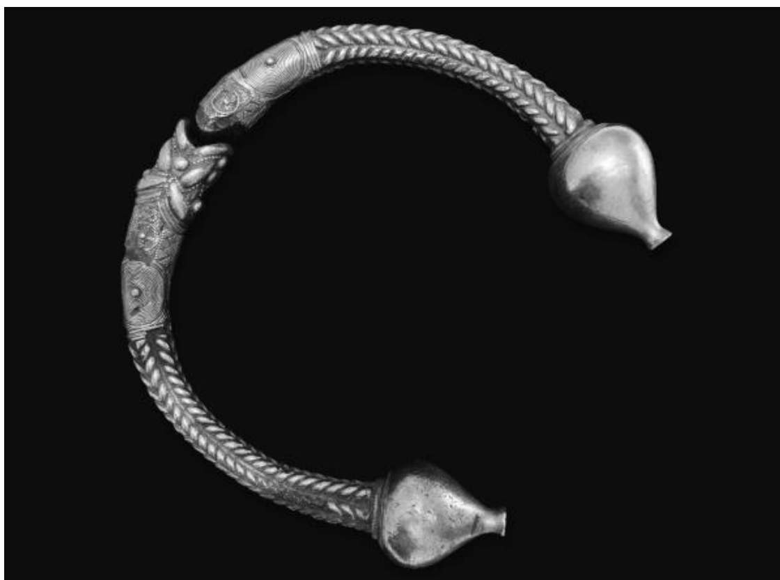
Золотой кельтский торквес. Ок. II в. до н. э.

...Древнеримский полководец IV века до нашей эры Тит Манлий получил прозвище Торкват (дословно – «украшенный ожерельем») за то, что в бою один на один с кельтом громадного роста сорвал с шеи противника ожерелье-торквес и надел на собственную шею.