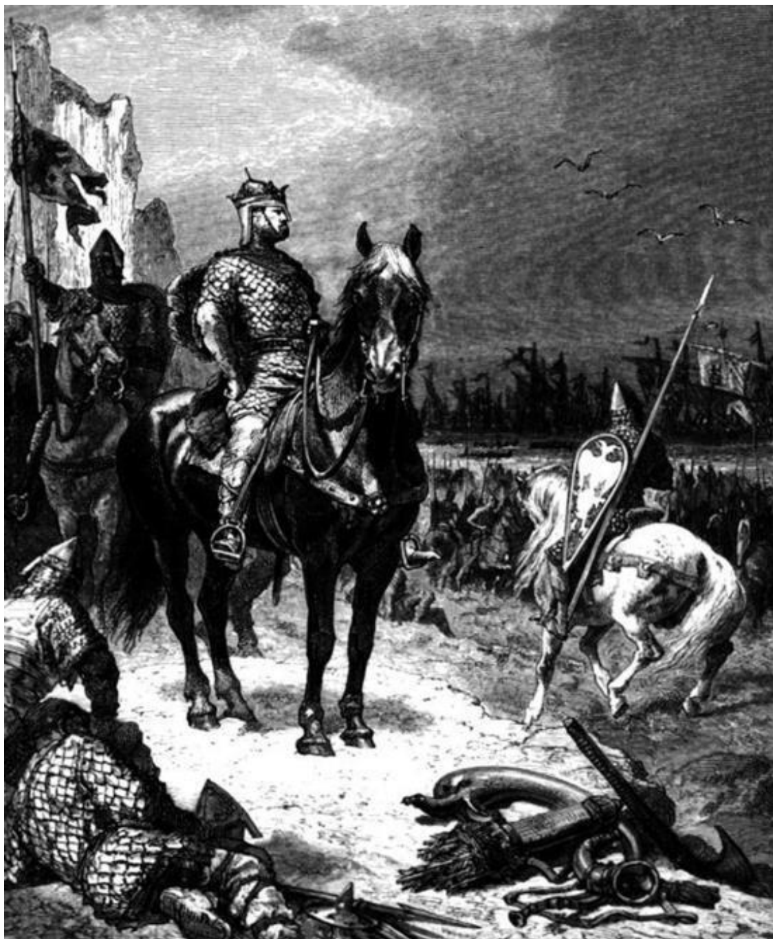
А. де Невилль. Вильгельм Завоеватель. 1883 г.