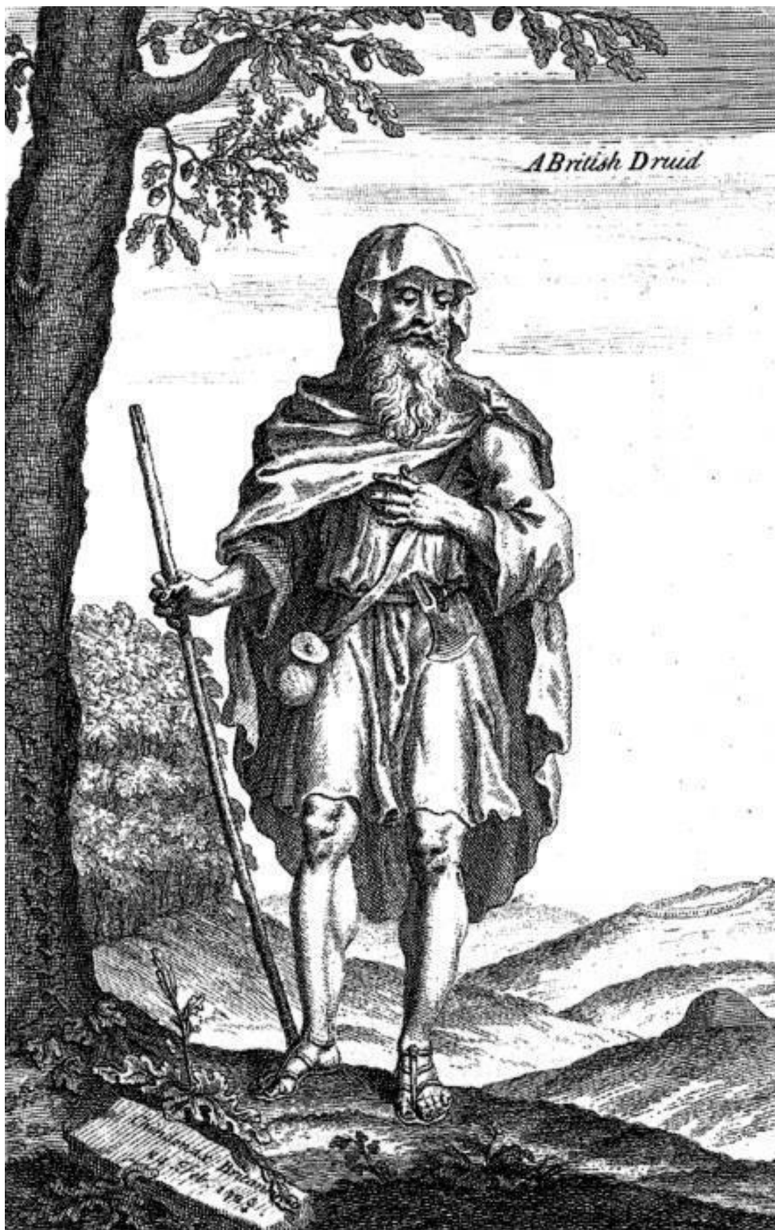
У. Стьюкли. Друид. 1724 г.