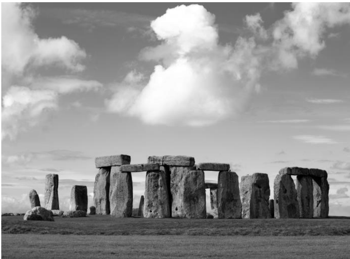
Стоунхендж. Современное фото

Римляне пытались откупиться от врагов. Бренн согласился снять осаду за тысячу мер золота. Когда наступил день оплаты, кельты заявили, что согласны отмерять золото только теми гириями, которые они принесли с собой. При этом кельтские гири были значительно тяжелее римских. Римские трибуны робко запротестовали, сказав, что при использовании кельтских гирь им придется заплатить не тысячу мер, а значительно больше. И тогда Бренн положил на весы свой меч и произнес ставшую крылатой фразу: «Горе побежденным!»