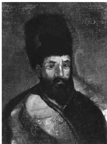
Портрет Е. И. Пугачева, написанный на портрете Екатерины II. Неизвестный художник. XVIII в.

Указы эти и в самом деле нарушили хрупкое равновесие в обществе. Своим манифестом Петр III даровал дворянам освобождение от службы – теперь того же ждали и крестьяне. Ведь крепостная зависимость крестьян в некотором смысле издревле была их службой отечеству: дворянин по первому повелению государя обязан был явиться на военную службу с людьми и провиантом; его крестьяне обеспечивали этот провиант, вооружение и платили подати. Теперь равновесие рухнуло. Крестьяне больше не находили никакого смысла в своем крепостном состоянии.