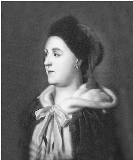
Екатерина II. Неизвестный художник. XVIII в.

В первые дни после переворота Екатерина распорядилась вознаградить его участников, отменила многие указы Петра III, в том числе все его нововведения в армии. 6 июля был обнародован особый Манифест с обвинениями против Петра III.