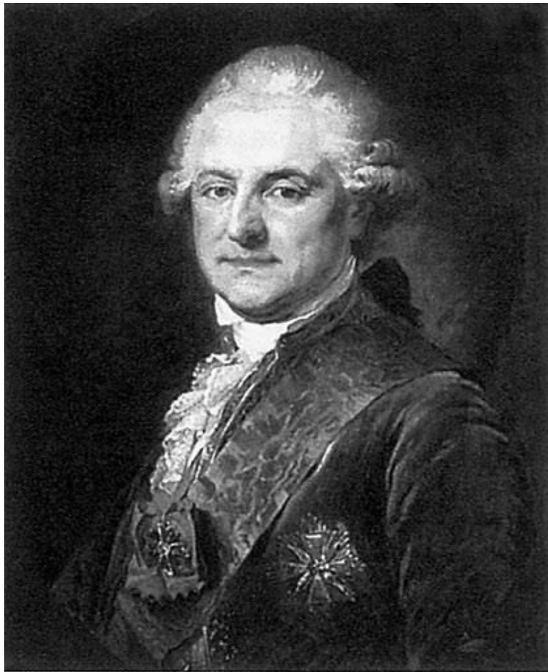
Станислав II Август Понятовский, король Польши. Ху-