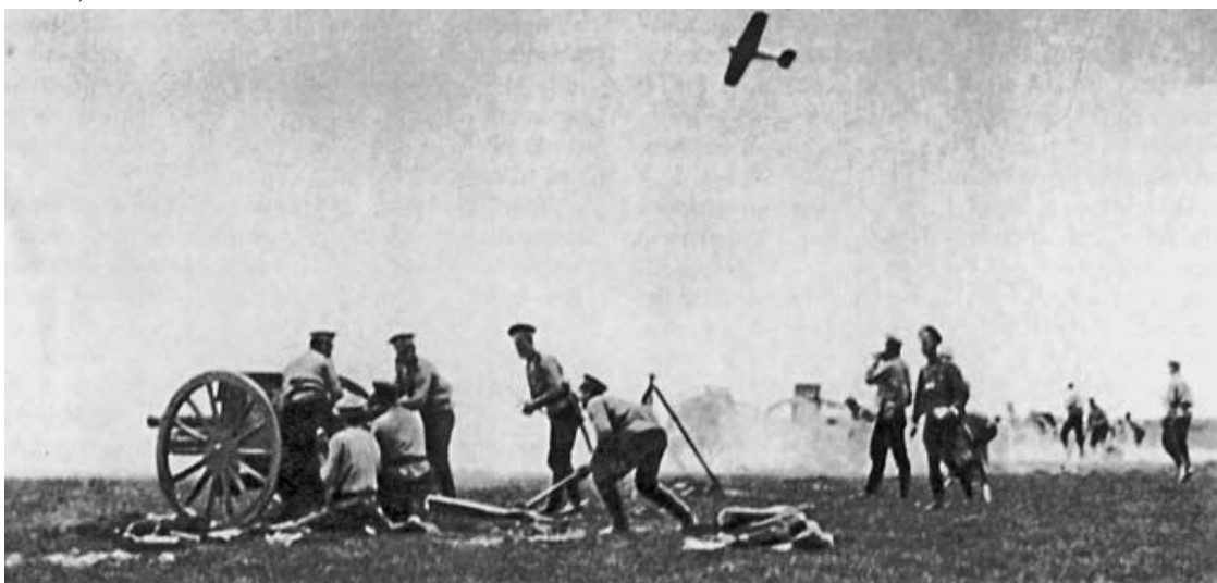
Огонь артиллерийской батареи

С этого времени серьезное давление на правительство стали оказывать консервативные круги, такие как группа «Общество за экономическое возрождение России», созданная по инициативе крупного предпринимателя Путилова, «Республиканский центр» промышленника Рябушинского. Ожилились монархические организации. Но самой серьезной силой стал «Союз армейских и флотских офицеров», организованный бывшим главнокомандующим Алексеевым и генералом Деникиным. К августу в нем состояли десятки тысяч патриотически настроенных людей. На фронте Союз создавал «ударные отряды» (первый такой отряд был сформирован еще в мае).