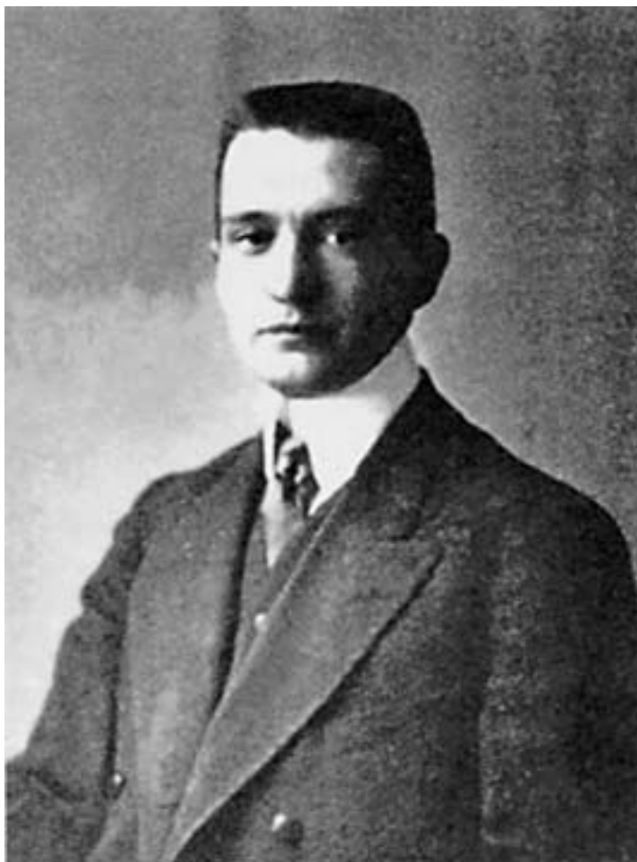
Председатель Временного правительства А. Ф. Керенский. Петроград. 1917 г.

На следующий день Ленин изложил руководству партии свои «Апрельские тезисы». Он утверждал, что Февральская революция лишь первый шаг к настоящей, социалистической революции, что партия должна ни в чем не поддерживать Временное правительство и взять курс на создание республики Советов, которая станет государственной формой диктатуры пролетариата. В будущей советской республике вся земля должна перейти в руки государства, частная собственность быть конфискована, все банки объединены в один общенациональный банк, действующий под контролем Советов, все производство и распределение взято под рабочий контроль. А в данный момент нужно настаивать на прекращении войны любой ценой, игнорировать решения правительства и перехватывать у него власть с помощью Советов.