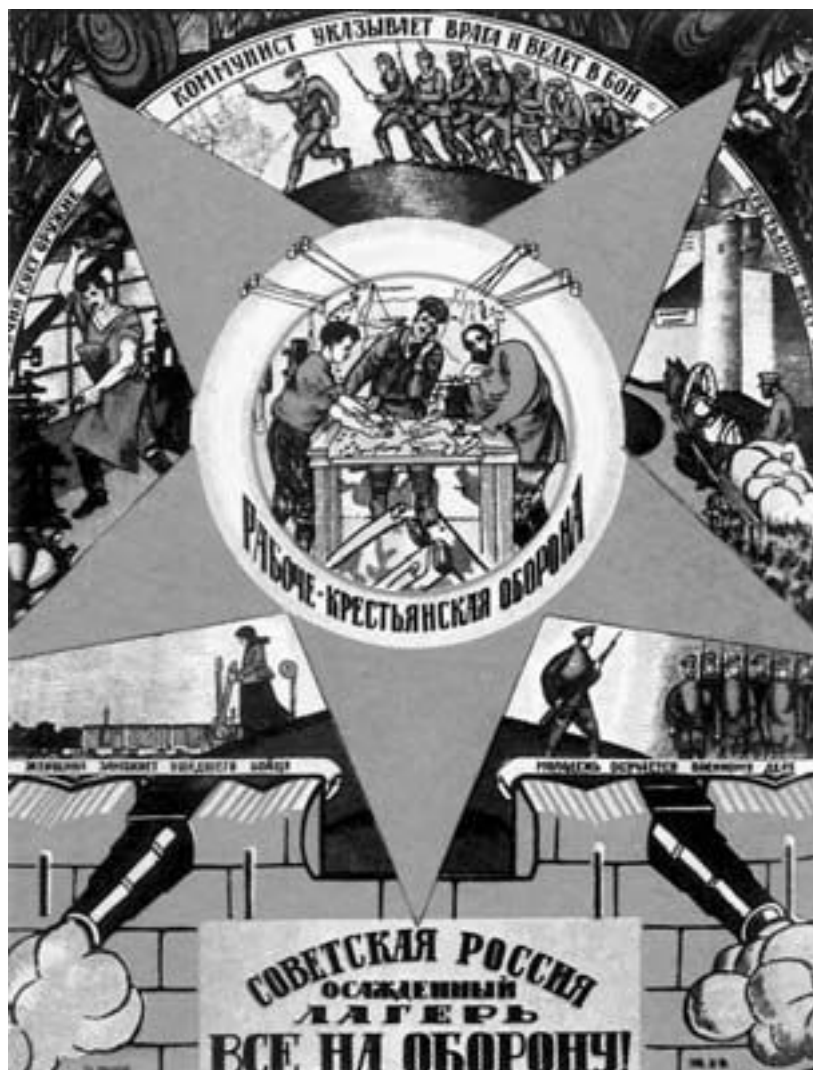
Плакат 1920 г. Художник Д. С. Моор.

Большевики отказались от принципа добровольности революционных вооруженных сил и объявили о всеобщей мобилизации. С этого момента вооруженное противостояние сторонников и противников советской власти перешло в полномасштабную гражданскую войну.