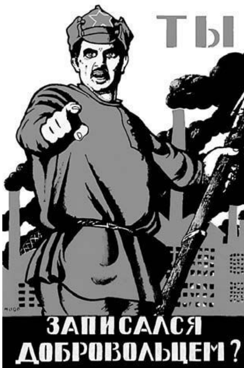
Плакат Д. С. Моора. 1919 г.