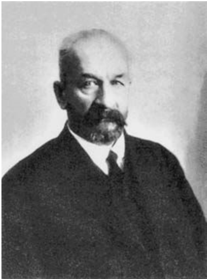
Первый председатель Временного правительства князь Г. Е. Львов. Петроград. 1917 г.