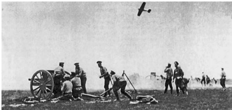
Огонь артиллерийской батареи

С этого времени серьезное давление на правительство стали оказывать консервативные круги, такие как группа «Общество за экономическое возрождение России», созданная по инициативе крупного предпринимателя Путилова, «Республиканский центр» промышленника Рябушинского. Оживились монархические организации. Но самой серьезной силой стал «Союз армейских и флотских офицеров», организованный бывшим главнокомандующим Алексеевым и генералом Деникиным. К августу в нем состояли десятки тысяч патриотически настроенных людей. На фронте Союз создавал «ударные отряды» (первый такой отряд был сформирован еще в мае).