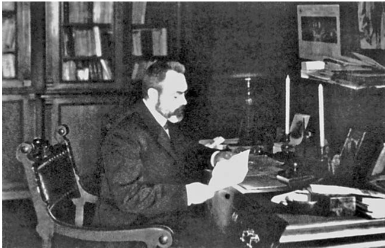
Министр Временного правительства А. И. Гучков. Петроград. 1917 г.

Предложения Ленина были встречены настороженно и даже с недоумением. Некоторые были настроены на открытое противодействие власти. Другие опасались, что антиправительственная пропаганда подорвет авторитет партии в массах. И всех смущал тезис о выходе из войны. С одной стороны, силы страны были полностью истощены, с другой – выйти из войны можно было только ценой сепаратного мира с Германией на ее условиях. Это грозило оккупацией огромной части страны, подавлением революционного движения германскими войсками, колоссальной контрибуцией