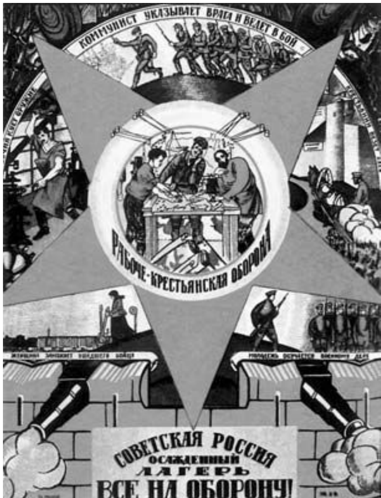
Плакат 1920 г. Художник Д. С. Моор.