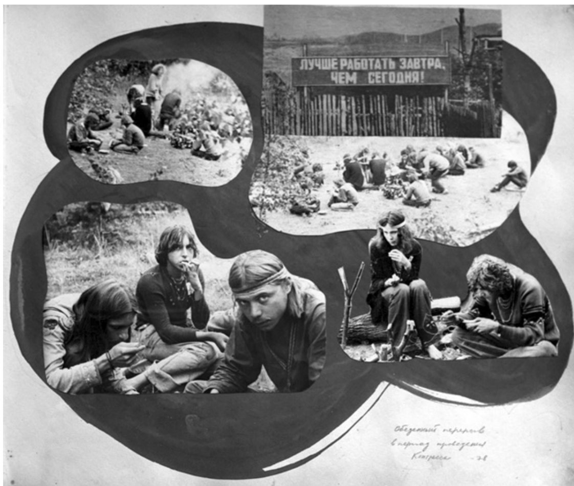
Ил. 4. «Лучше работать завтра, чем сегодня!» Хиппи во время проведения «конгресса» в Витрупе, 1978 год; страница из Пуплбука Саши Художника.

Советские хиппи так и не написали свою историю, но если бы они это сделали, то наверняка назвали бы ее «Кратким курсом». Ведь они окрестили Системой свободную федерацию хиппи всего Советского Союза, в чем невозможно не заметить отсылку к другой системе – системе советской власти. «Краткий курс» движения хиппи отвечал бы ироничной отчужденности советских хиппи от советского общества – которая, впрочем, сочеталась с необходимостью постоянно упоминать и высмеивать обстановку, в которой они существовали и которая содержала в себе идейную искренность и веру во всеобщее предназначение.