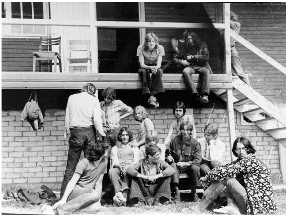
Ил. 15. Тусовка московских и эстонских хиппи, лето 1972 года.

Интересно, что в этой брошюре специально подчеркивалось, что хиппи представляют опасность не своим внешним видом и даже не тем, что употребляют наркотики, а «идеями». «Идеи» считались заразными и опасными не только для общества в целом, но и для самих комсомольцев-дружинников. Поэтому авторы инструкции стремились не допустить возникновения каких-либо симпатий у читателей. Один из парадоксов советского общества заключается в том, что наиболее страстные его критики и наиболее последовательные сторонники имели больше общего друг с другом, чем с теми, кто оставался беспристрастным наблюдателем. Так, инструкция выдает с головой ее авторов, которые как огня боятся того, что молодые дружинники, патрулирующие улицы, могут счесть хипповские идеи привлекательными для себя.