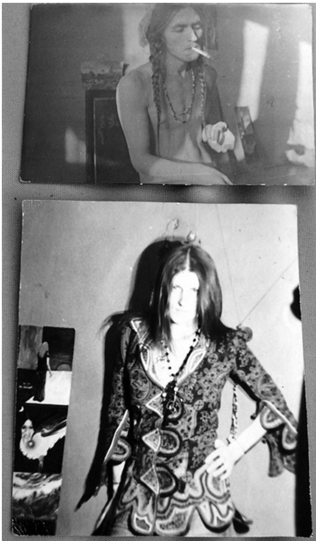
Ил. 1. Азазелло и Офелия.