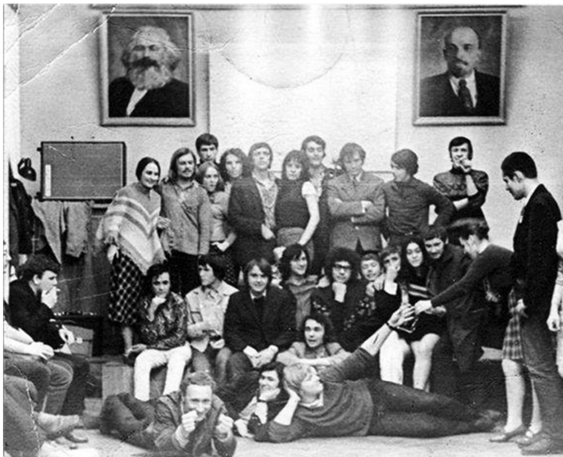
Ил. 13. Солнце и хиппи его первой Системы, 30 апреля 1971 года.