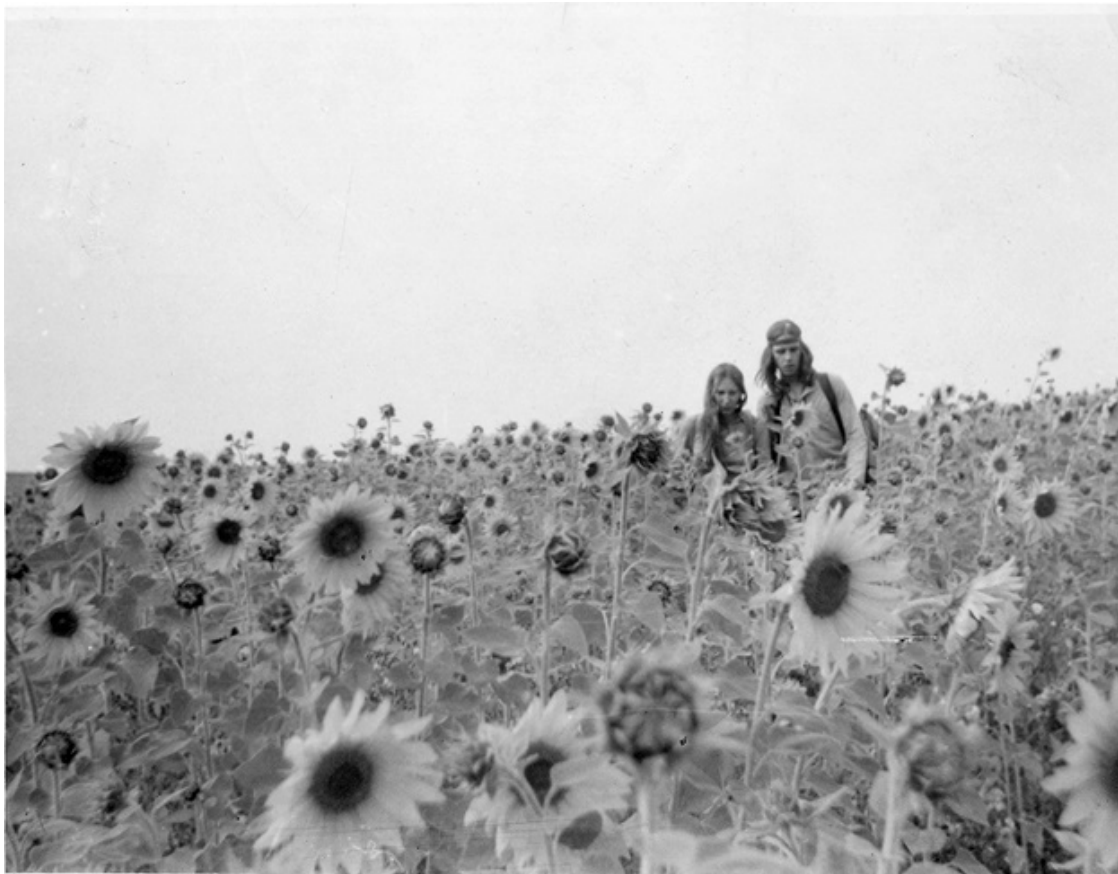
Ил. 3. Лена из Москвы и Гулливер из Горького.

очевидцев и привести в порядок зачастую хаотичные и запутанные свидетельства, которые мне удалось собрать. Это вовсе не значит, что в этой главе нет интерпретаций: будучи одним из первых летописцев хипповского движения, я взвешивала и оценивала свидетельства, записывая историю, которая неизбежно предвзята и нерепрезентативна: ее действие разворачивается в Москве, и у нее есть несколько главных героев, которые в моей интерпретации играли основную роль в продвижении повествования. Сейчас я в полной мере осознаю ошибки, которые допустила, чтобы сделать эту историю более удобной для чтения. Вторая глава является анализом различных аспектов хипповского движения и включает части, посвященные идеологии, кайфу, материальности, безумию и женщинам-хиппи.