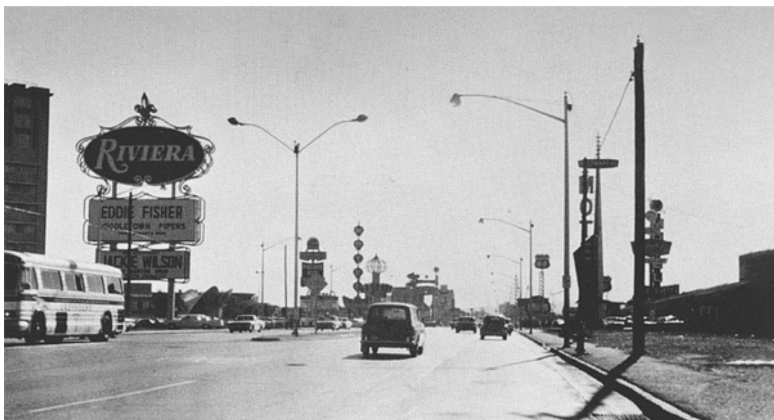
Илл. 1. Лас-Вегас-Стрип. Вид на юго-запад

На коммерческую полосу, образцом которой является Лас-Вегас-Стрип (илл. 1, 2), архитектору не так-то просто посмотреть доброжелательными, менее воинственными глазами. Архитекторы вообще давно разучились смотреть вокруг без осуждения – ведь исповедуемый ими ортодоксальный модернизм по определению прогрессивен, если не революционен, утопичен и проникнут духом пуризма; он не удовлетворяется существующим состоянием. Модернистской архитектуре до сих пор было свойственно всё что угодно, только не терпимость: архитекторы предпочитали изменять существующую среду вместо того, чтобы пытаться ее улучшить.