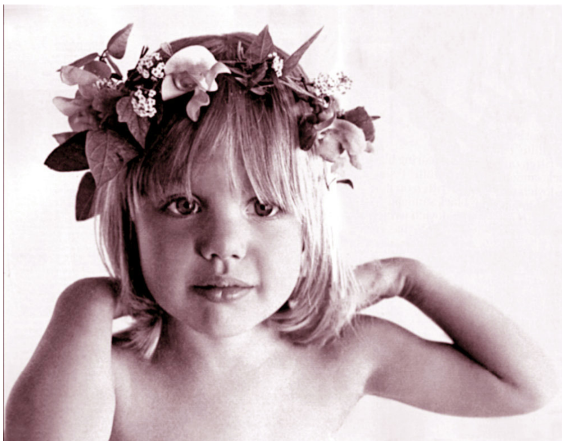
Будучи еще ребенком, Анджелина умела «работать на камеру»