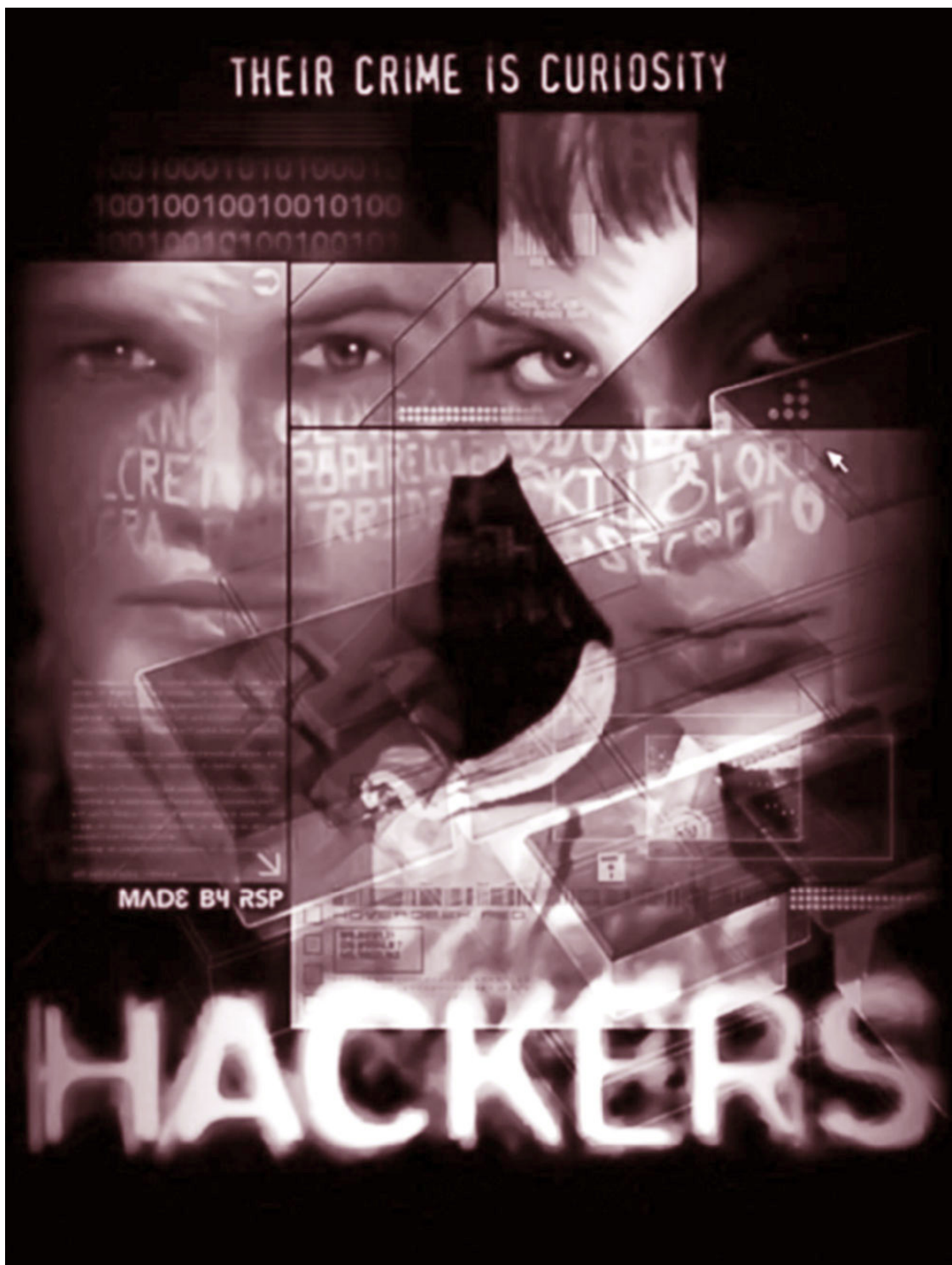
Афиша к фильму «Хакеры»

Как покажет будущее, «вращать» в эмоции на съемочной площадке настолько, чтобы всерьез увлекаться своими партнерами по фильмам, для Анджелины достаточно естественно. Она играет так же, как живет, не всегда находя – и не всегда пытаюсь найти! – границы между собой реальной и собой в роли кого-то еще. В сущности, в этом и заключается, возможно, ее истинный драматический талант – Анджелина всегда остается искренней, не пытаюсь переделывать себя под своего персонажа, а попросту находя своего персонажа в себе.