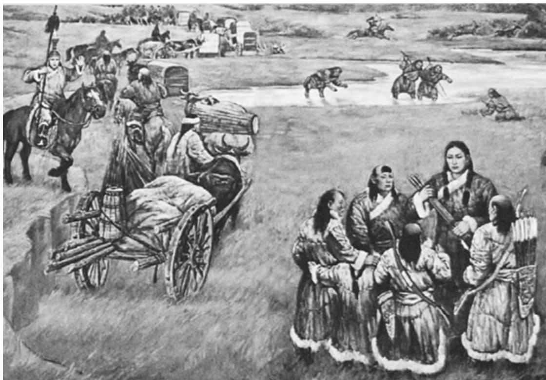
Мать Чингисхана Огэлун пересказывает своим сыновьям легенду об Алан гоо. Панорама. Музей города Хух-хот (КНР)