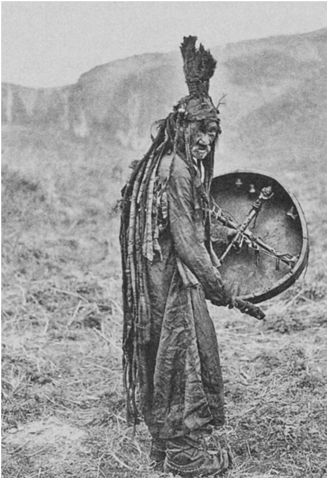
Камлание монгольского шамана

В древнемонгольских преданиях, посвященных поклонению огню, кусты, деревья, их ветви упоминаются с большим почтением: