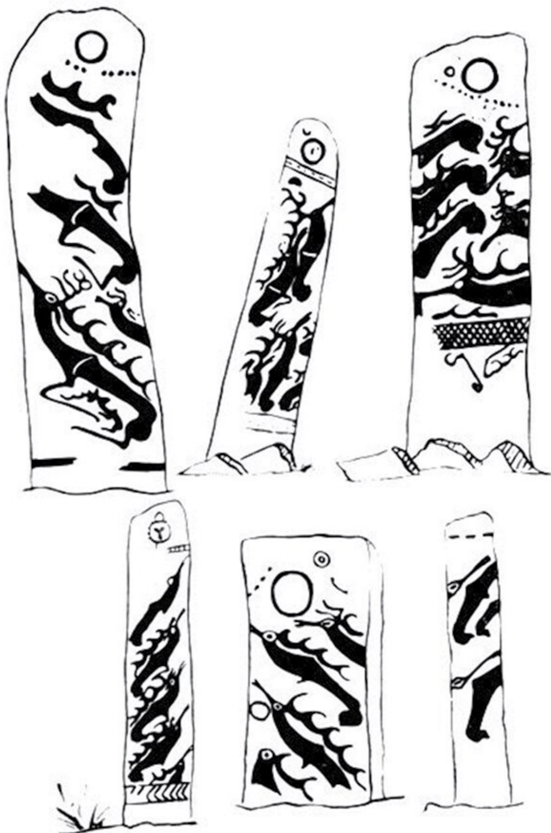
Изображения на оленных камнях (Монголия)