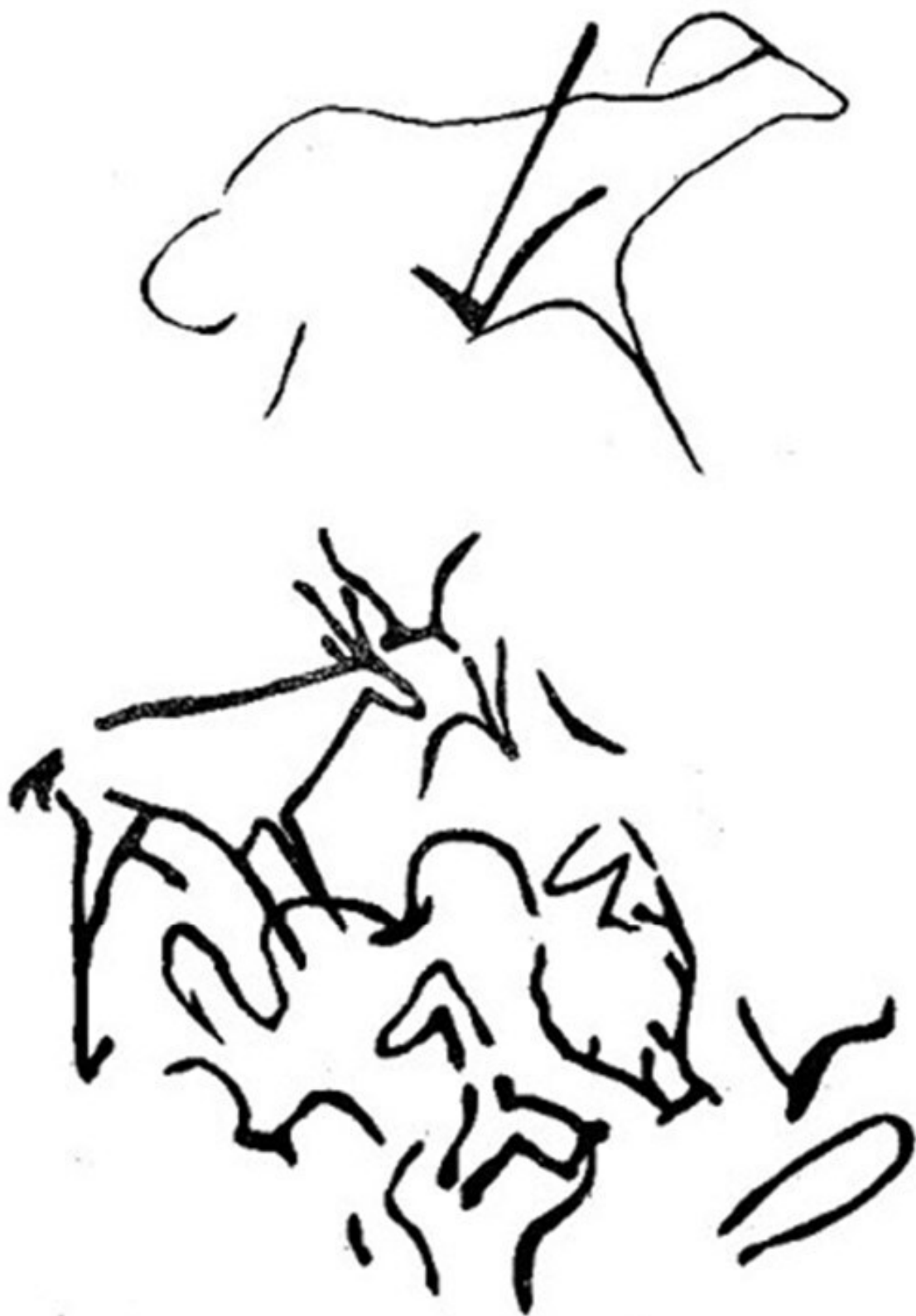
Рисунки барана и антилопы (пещера Хойд-Цэнхэрийн-агуй)

В те далекие времена люди еще не отделяли себя от природы и поэтому либо считали себя ее частью, либо, как отдельные роды или племена, верили в то, что имеют общее происхождение с конкретными видами растений или животных, а иногда и с неодушевленными предметами. Между тем группы людей или же члены одного рода имели невидимую таинствен-