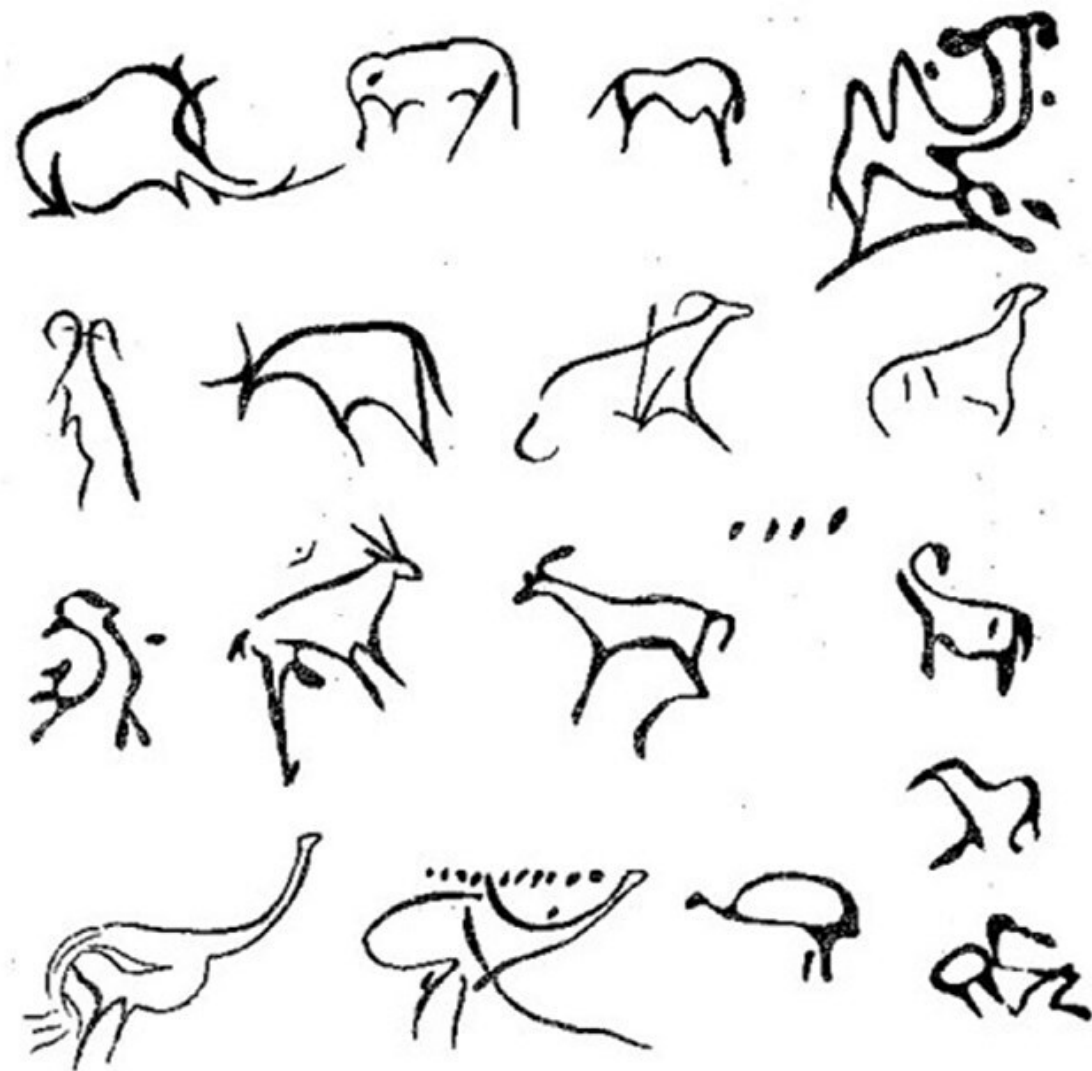
Изображения животных и птиц (горных баранов, козлов, лошадей, страусов, слонов (или мамонтов)) в пещере Хойд-Цэнхэрийн-агуй

листическому исполнению рисунки, сделанные охрой, отличаются от других памятников азиатского региона той же эпохи специфическим мастерством. В них нет изображения человека, что доказывает принадлежность рисунков периоду палеолита. И еще в рисунках пещеры Хойд Цэнхэр, кроме ныне обитающих, изображались животные, которые жили и были уничтожены в начале четвертичного периода.