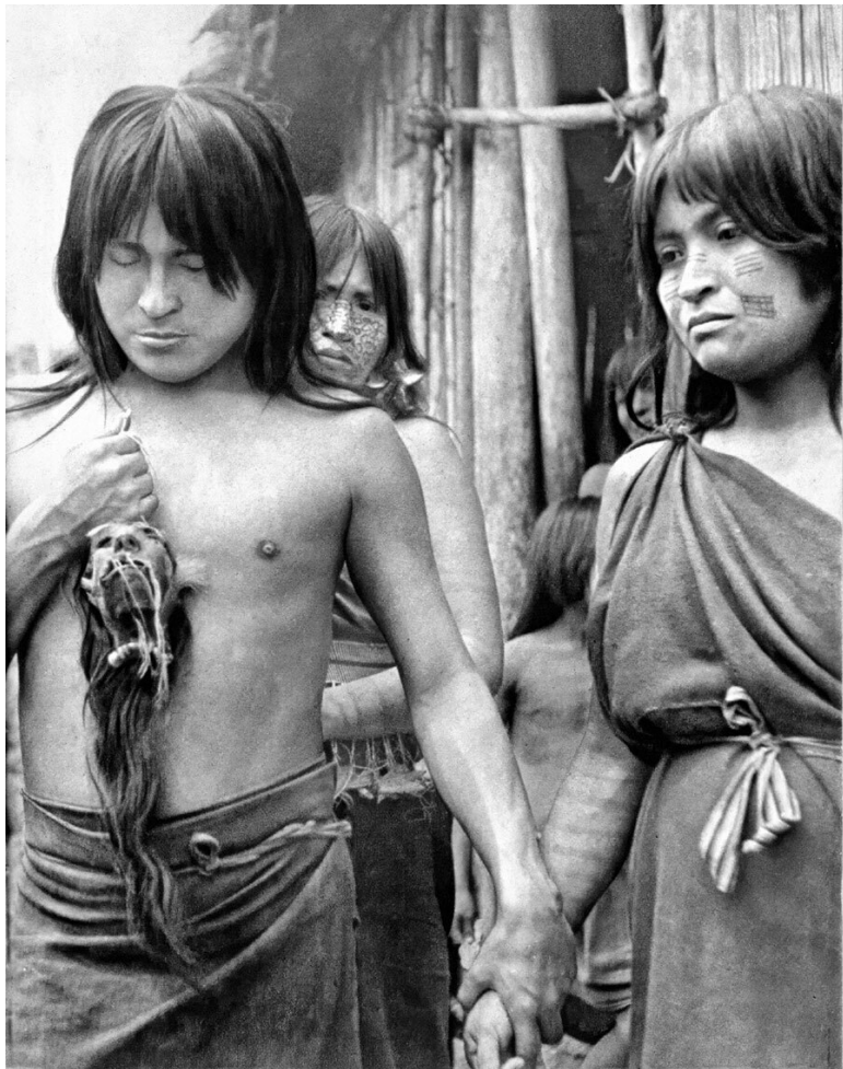
Молодой индеец-хиваро с тсантсой на груди проводит обряд подчинения духа убитого врага