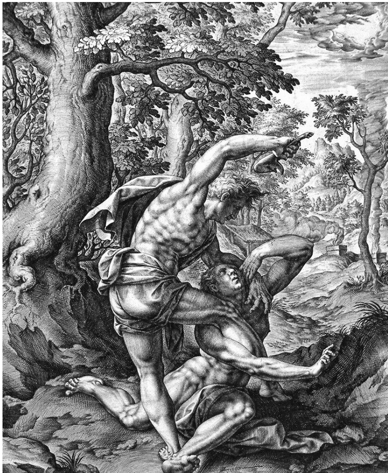
Каин и Авель. Гравюра XVI век

Выдающийся этнограф и историк Джеймс Фрезер, рабо-