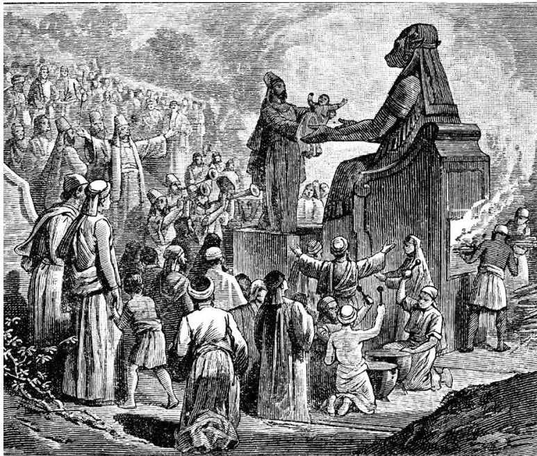
Жертвоприношение Молоху. Гравюра XIX века

Нечто похожее происходило и в соседней Финикии – Сирии, где существовал схожий культ. К сожалению, древние историки ничего не придумали и не преувеличили: близ храмов жутких божеств археологи нашли тысячи урн с обгорелыми младенческими останками.