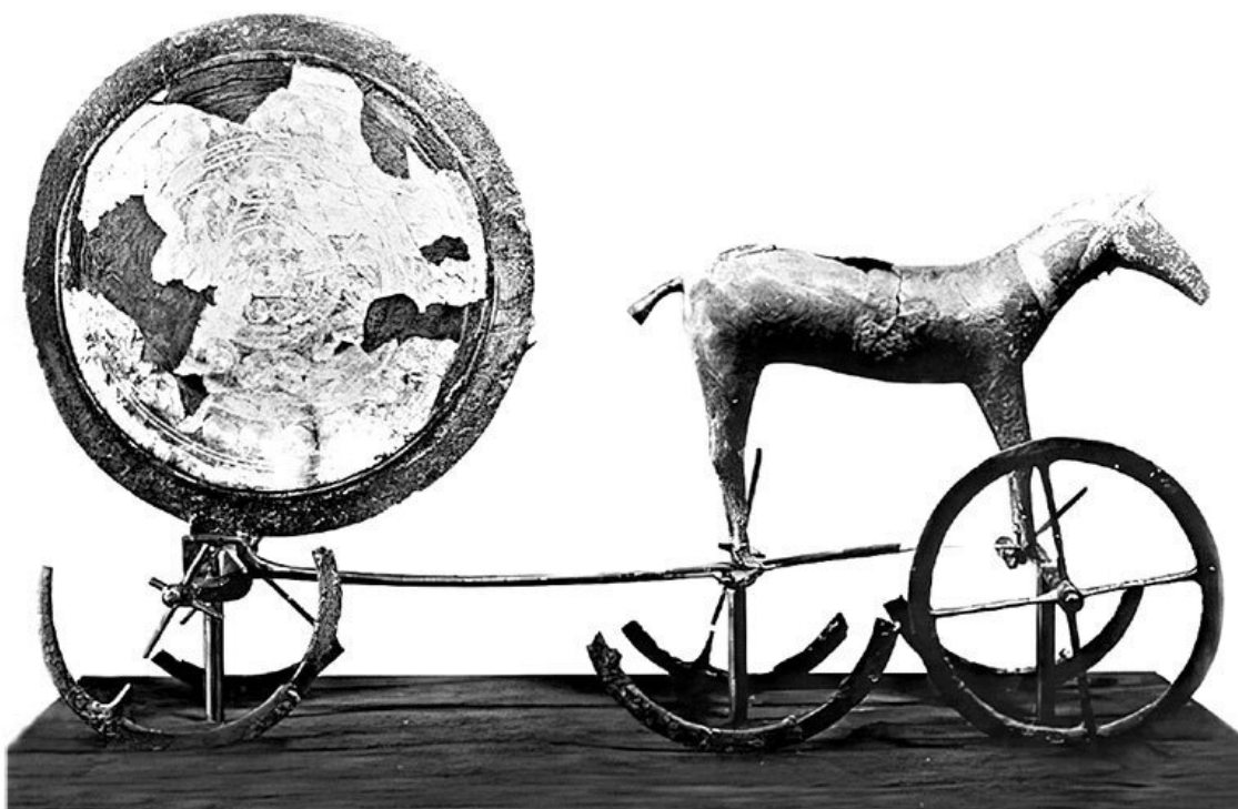
Колесница с солнечным диском из Трундхольма в Дании.

Правда, у германцев это была поначалу странная, на современный взгляд, алчность. Археологи находят драгоценную римскую посуду... в погребениях германских вождей. Золото и серебро ценится в загробном мире больше, чем при жизни (если верить Тациту). В последующие века богатства приносятся в жертву в традиционных германских и скандинавских святилищах – убивают людей (пленных?), скот, массу ремесленных изделий, оружия, украшений из золота и серебра, культовых (вотивных) изображений бросают в озера (ставшие болотами). Оружие найдено намеренно поврежденным – поломанным на куски или изогнутым (об этой порче жертвенных предметов рассказывал Орозий).