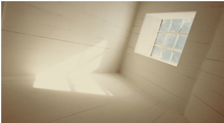
Provincetown, Joel Meyerowitz, 1977

А на практике мы увидим, что не все так однозначно, потому что многие проблемы, особенно на психологическом уровне, просят комплексного подхода, то есть использования не одного, а сразу нескольких цветов.