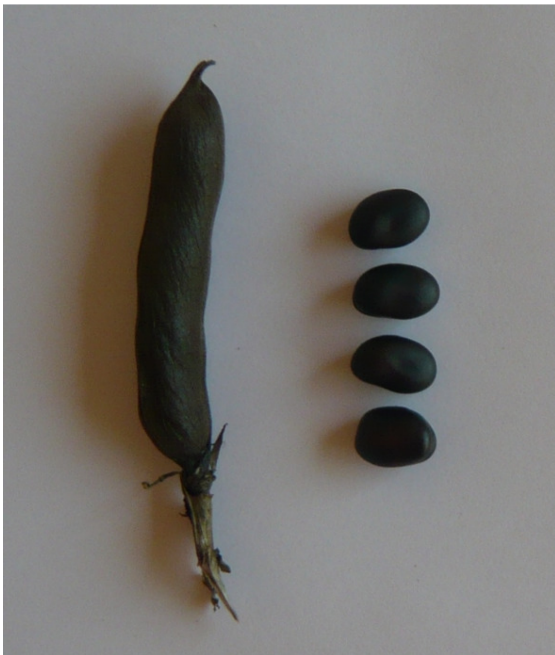
Фото 6. Плод и семена кормового боба

Окраска семян очень разнообразная. У большинства сортов семена светлые, но имеются формы с семенами черного, фиолетового, зеленого, темно-серого, коричневого и вишневого цвета. Семена, темнеющие под влиянием света и других условий, не теряют всхожести, однако, это свидетельствует о наличии в них танина. Срок хранения семян – 10—12 лет.