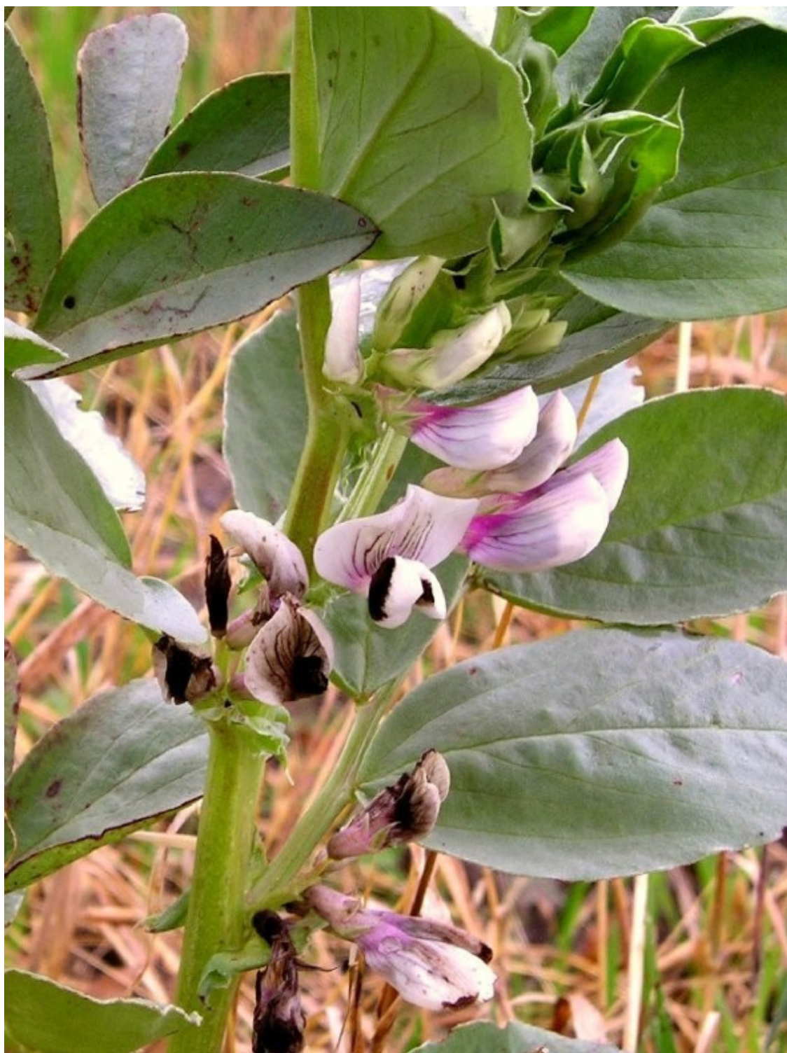
Кормовые бобы (сорт – Дагестанский местный)