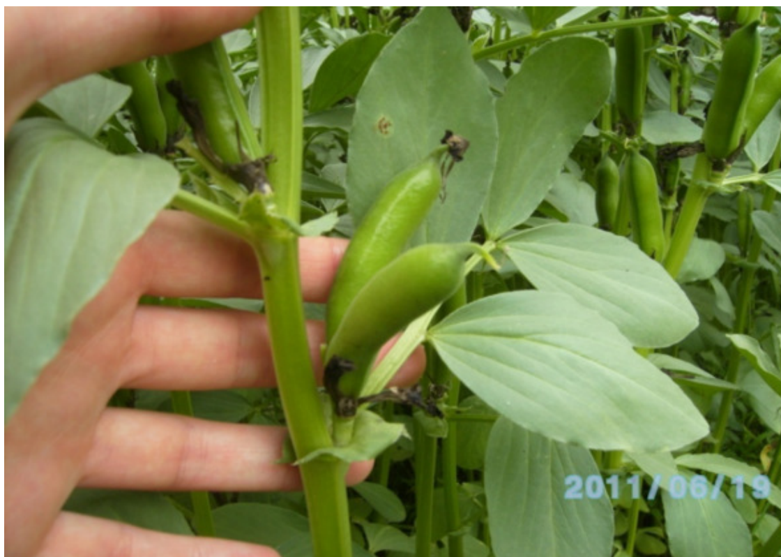
Фото 2. Парноперистые листья кормовых бобов

Верхушечный усик редуцирован в остроконечие. Морфологическая ярусность листьев отражает стадийную разнокачественность тканей стебля, по которой листья кормовых бобов можно условно разделить на листья вегетативной и генеративной сферы. Нижние листья 1-парные, средние 2-парные, верхние 3-, 4-парные. Листочки по величине делят на: узкие – до 3 см, широкие – до 5 см, короткие – 5—7 см, длинные – 7—8 см. Прилистники бывают мелкие (1,4—1,6 см) и крупные (2,1—2,5 см). Они могут быть с антоциановым пятном или без него.