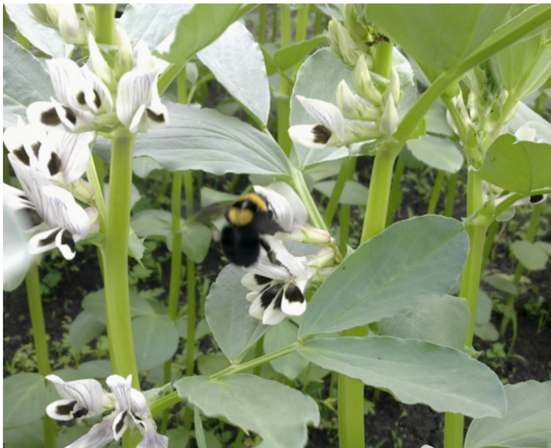
Фото 7. Шмель на цветке кормовых бобов.

У бобов, в отличие от большинства зерновых бобовых, наблюдается определенная степень перекрестного опыления и при совместном произрастании различных сортов на одном и том же участке наблюдаются частые случаи переопыления. Пыльца переносится медоносными пчелами и шмелями. При размножении двух сортов и более необходимо соблюдать пространственную изоляцию: 1000 м в условиях открытого пространства и 500 м при наличии естественных преград (высоких разделительных посадок).