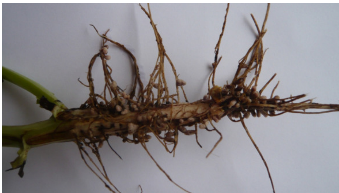
Фото 1. Стержневой корень кормовых бобов с азотофиксирующими клубеньками

Корень – проникает в почву на глубину до 150 см. Боковые ответвления охватывают большой объем почвы. Основное количество придаточных корней находится в пахотном горизонте.