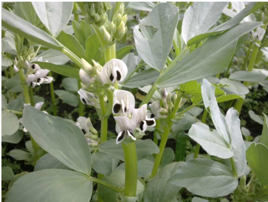
Фото 3. Типичные цветы кормовых бобов

Наиболее типичная для бобов окраска цветка – белая с черными или темно-фиолетовыми пятнами на крыльях, хотя существует желтая, красная, коричневая и чисто белая. Пазушные цветки крупные – 2,5—3,5 см. Их размер зависит от положения в кисти: верхние всегда уступают в размере расположенным ниже.